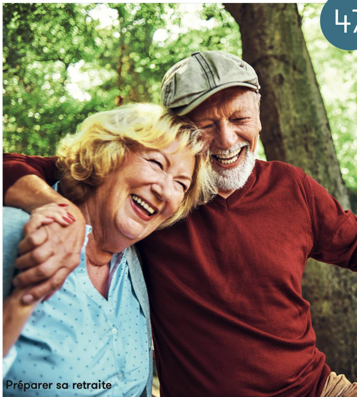
Préparer sa retraite