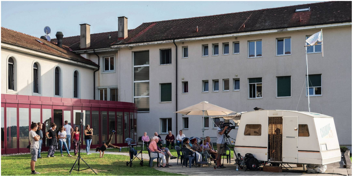
La caravane devient vite l'attraction, comme ici aux Peupliers, au Muret.