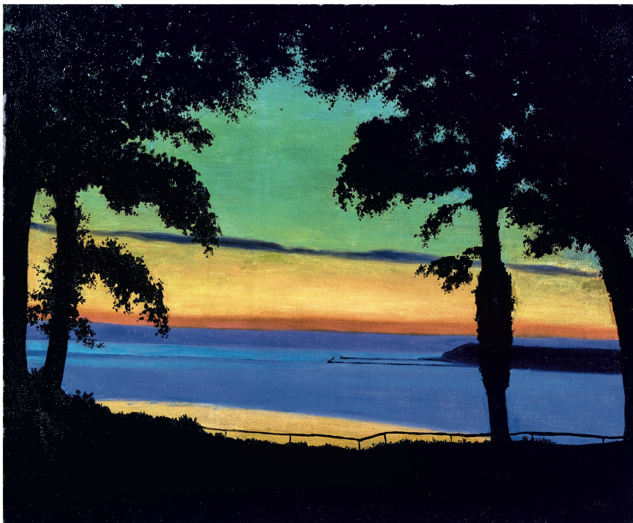
Félix Vallotton Soir, Côte de Grâce

Musée d'art moderne et contemporain de Saint-Etienne Métropole.