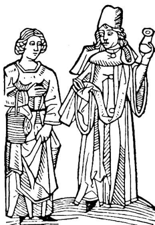
Abb. 3. Arzt mit Matula, Frau mit Korb dafür (aus: ALB. SCHWAMM, Der Bilderschmuck der Frühdrucke , Bd. 6: Konrad Dinckmut, Leipzig 1923)

Oberfläche (corona, superficies). Der Flüssigkeitsgrad wird durch sanftes Hin- und Herschwenken der Matula festgestellt, welche Manipulation auch zur Prüfung der Contenta dienen kann. Manchmal wird der gleiche Harn nach Stunden einer zweiten Betrachtung unterzogen und, nachdem er an schattigem und mäßig kühlem Ort gestanden, auf seine eventuellen Veränderungen geprüft. Oft wird beim gleichen Kranken tagtäglich uroskopiert und auf Grund dieser fortgesetzten Harnschau der Krankheitsverlauf beurteilt und zu beeinflussen gesucht. Auf drei Beurteilungen fußt also in der Hauptsache die Harnschau, nämlich derjenigen 1. der Farbe, 2. des Flüssigkeitsgrades, der Konsistenz oder Substanz, und 3. der ungelösten Harnbestandteile, der Contenta, der «Schwemnteilchen» wie R. THIEM mit K. SUDHOFF sich ausdrückt.