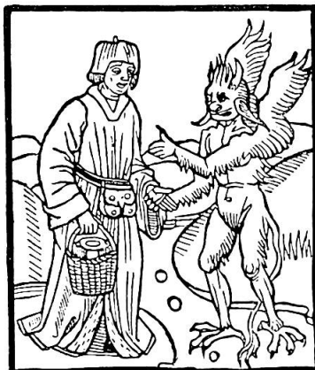
Abb. 5. Arzt mit Harnglas im Korb, im Gespräch mit dem Teufel. Holzschnitt aus Le livre de Mathéolus , Paris 1492 (nach G. VIEILLARD, L'urologie et les médecins urologues , Paris 1903)

Dieses Lehnwort aus dem Griechischen deutet auf eine helle Grün-Nuance. Dies aber hauptsächlich im Zusammenhange dieser und anderer Harnfarbenskalen. Hauptbedeutungen von glaucus sind im Lateinischen «blaugrau, dunkelgrün», Nebenbedeutungen «graugrün, grünlich, bläulich». Im Unterschied zu den üblichen Verdeutschungen des ärztlichen Fachausdrucks Glaukom als «grüner oder schwarzer Star» bedeutet griech. glaukós als Beiwort der Augen «hellblau, überhaupt lichtfarbig» (BENSELER-KAEGIS Griechisch-deutsches Wörterbuch ), als Beiwort der Meeresfläche «blank». «Lichtfarben» übersetzt 1582 WILLICHIUS das glaucus und vergleicht einen dickflüssigen Harn dieser Farbe, eine Urina crassa glauca, mit älterm, rauchigem Laternenglas (wörtlich Laternenhorn, cornu veteris laternae obscuro propter fumos). – Besonders schwer verständlich ist die nächste Nuance im Bereich der weißlichgelblichen Harnfarben: