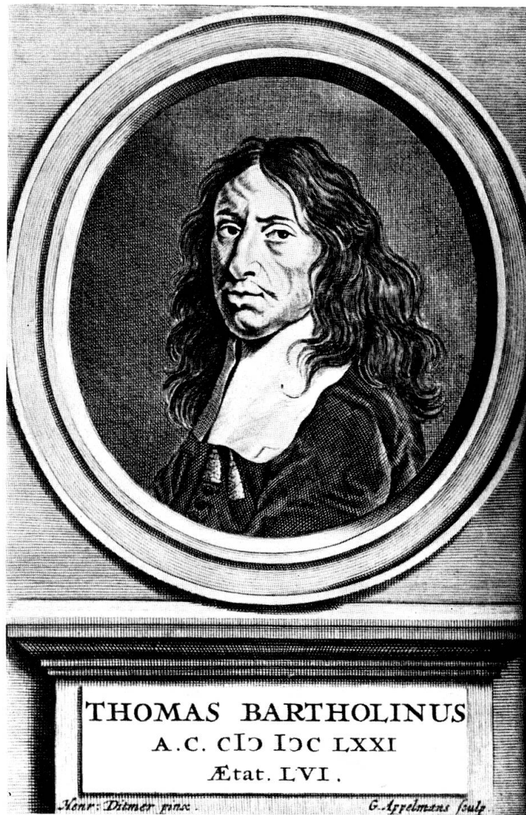
Abb. 1. Stenos Lehrer Thomas Bartholin im 56. Lebensjahr. Porträtstich aus dem Jahre 1671. Aus Thomae Bartholini Anatome renovata des CASPAR BARTHOLIN, Leiden 1673