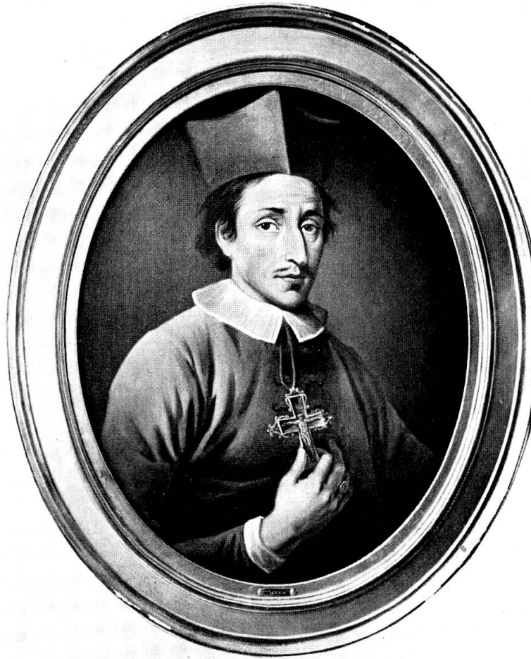
Abb. 4. Nicolaus Episcopus titiopolitanus. Erst nach dem Tod gemaltes Bildnis des Bischofs von CHRISTIAN AUGUST LORENTZEN (1749–1828), Anatomisches Institut Kopenhagen