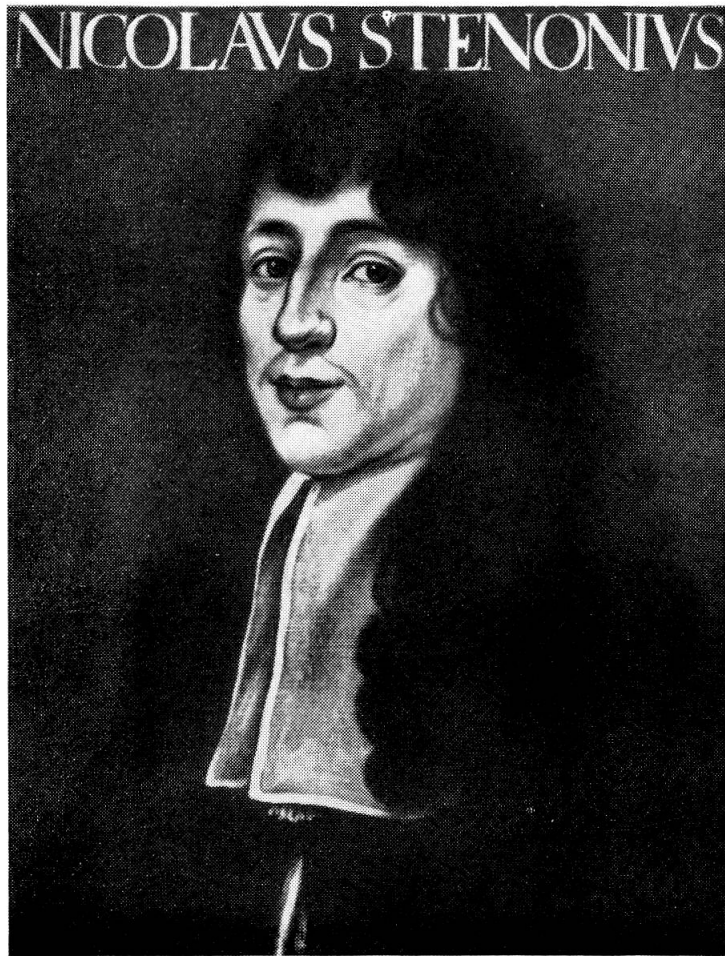
Abb. 2. Gemälde des 31jährigen Nicolaus Stenonius von einem unbekanntem italienischen Meister, 1669 gemalt, Uffizien, Florenz