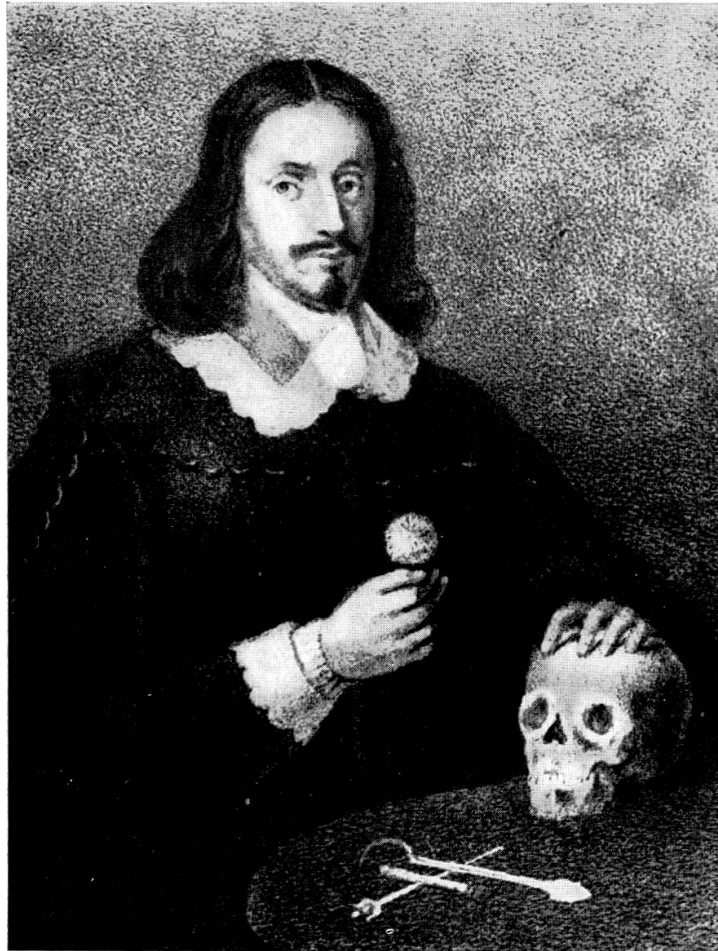
Abb. 4. Porträt des PAUL MARQUART SCHLEGEL (1605–1653). Gemälde eines unbekanntes Künstlers, im Besitz der Staats- und Universitätsbibliothek Hamburg