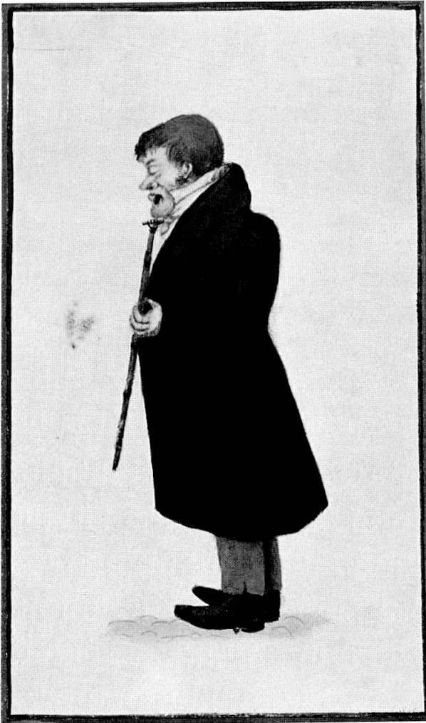
Karikatur von Theodor Meyer-Merian: Christian Friedrich Schönbein (1799–1868), Professor der Chemie in Basel