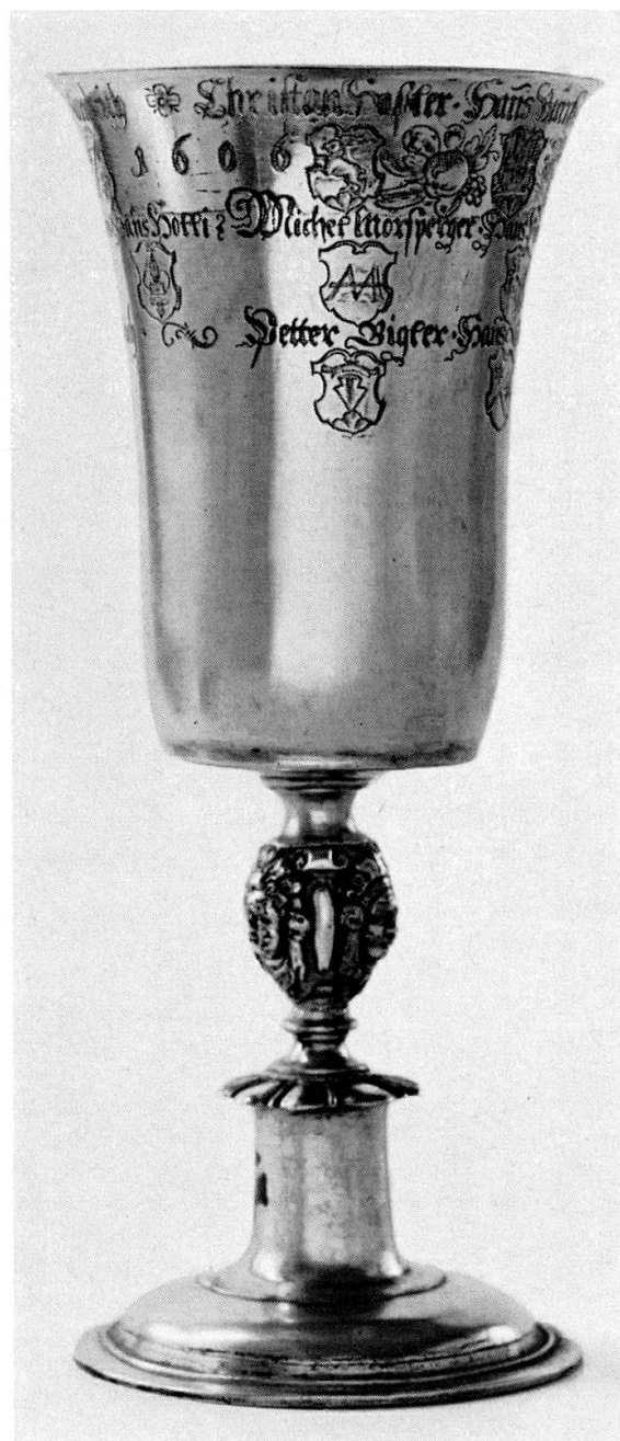
Abb. 1. Gerichtsbecher von Oberdießbach mit dem Wappen der Familie Hasler