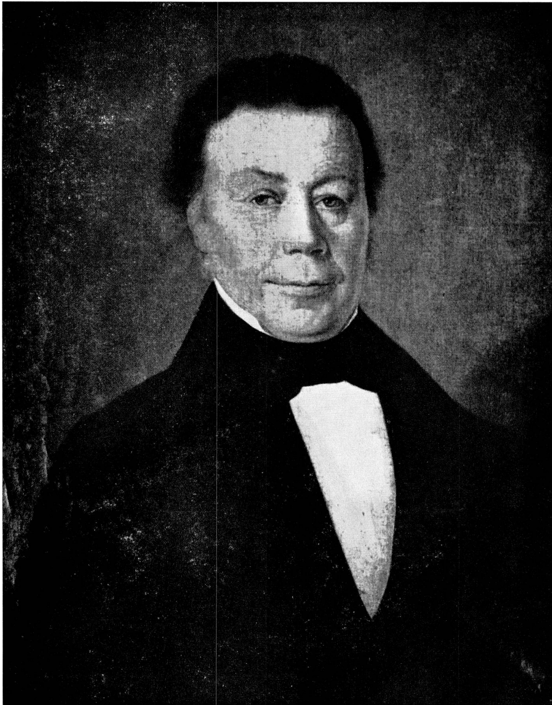
Abb. 2. Ignaz Venetz (66jährig, 1854). Gemälde von Laurent-Justin Ritz. Im Museum von Valeria, Sitten