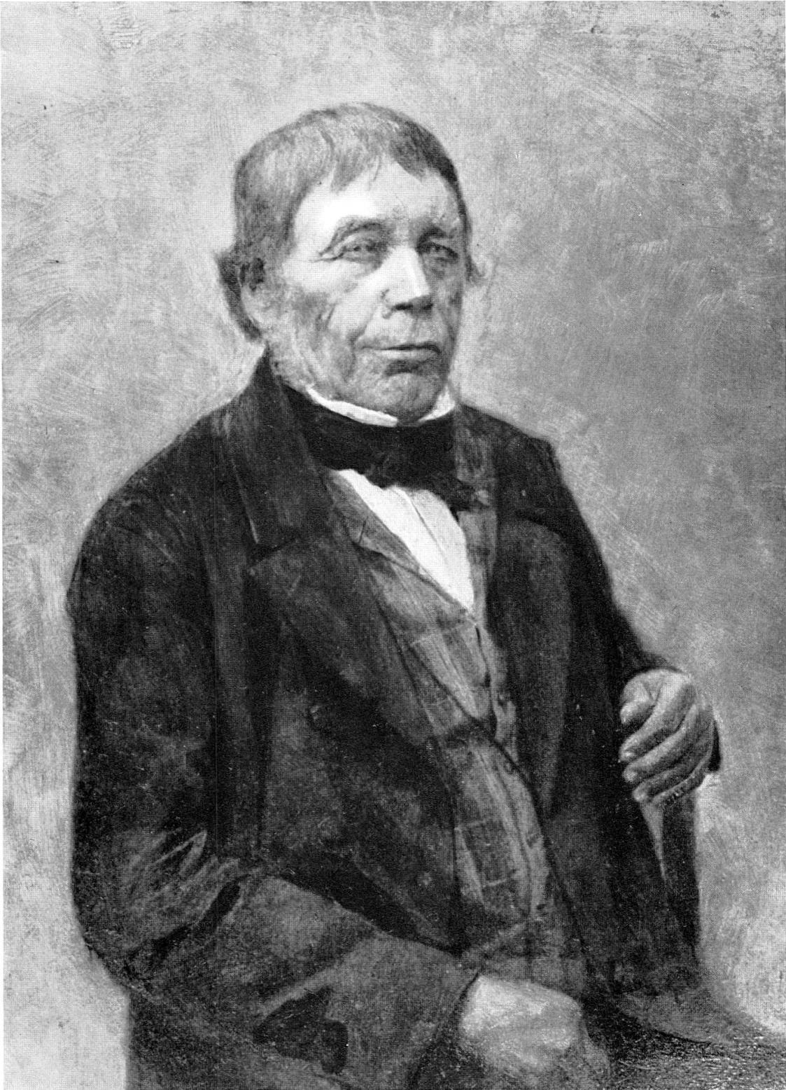
Abb. 3. Ignaz Venetz. Altersbildnis im Besitz des Naturhistorischen Museums Bern