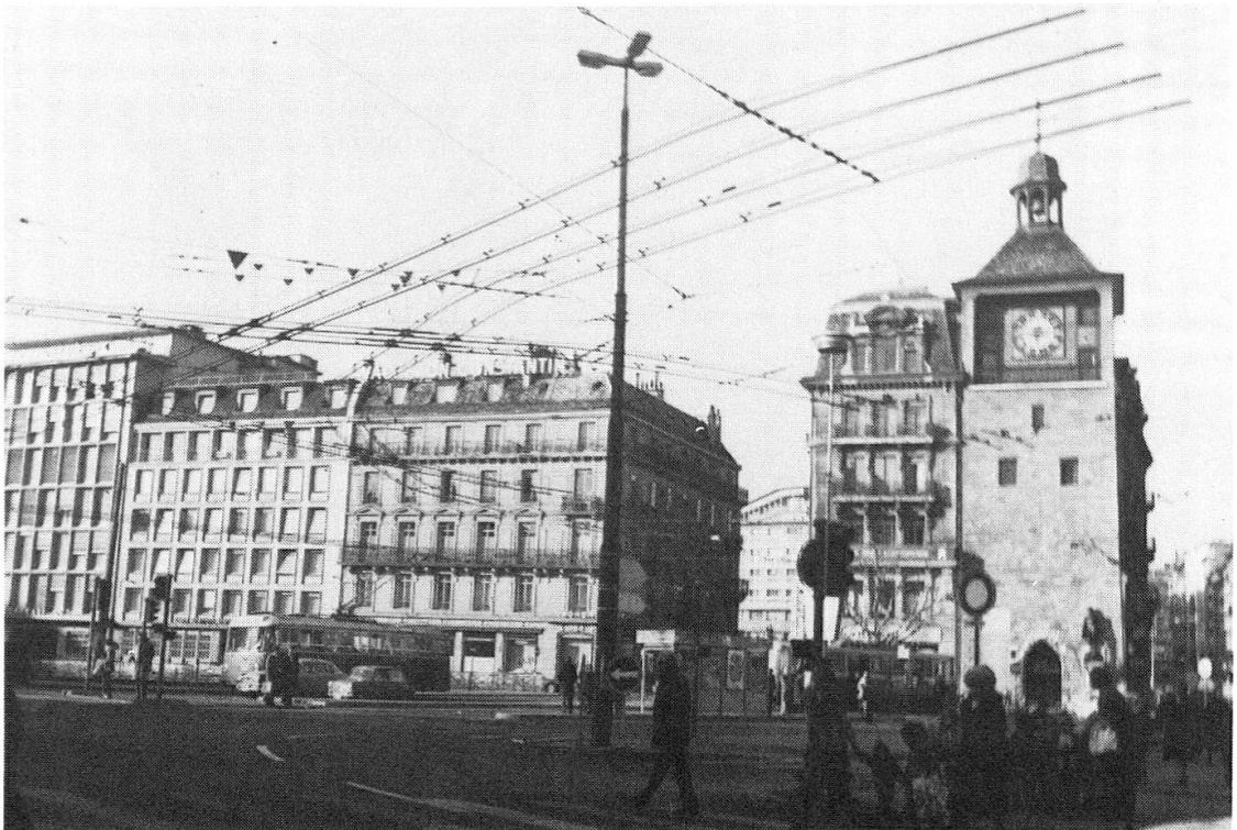
Fig. 3. Vues de la Place Bel-Air, a) par Geissler au XVIII e , b) en 1976