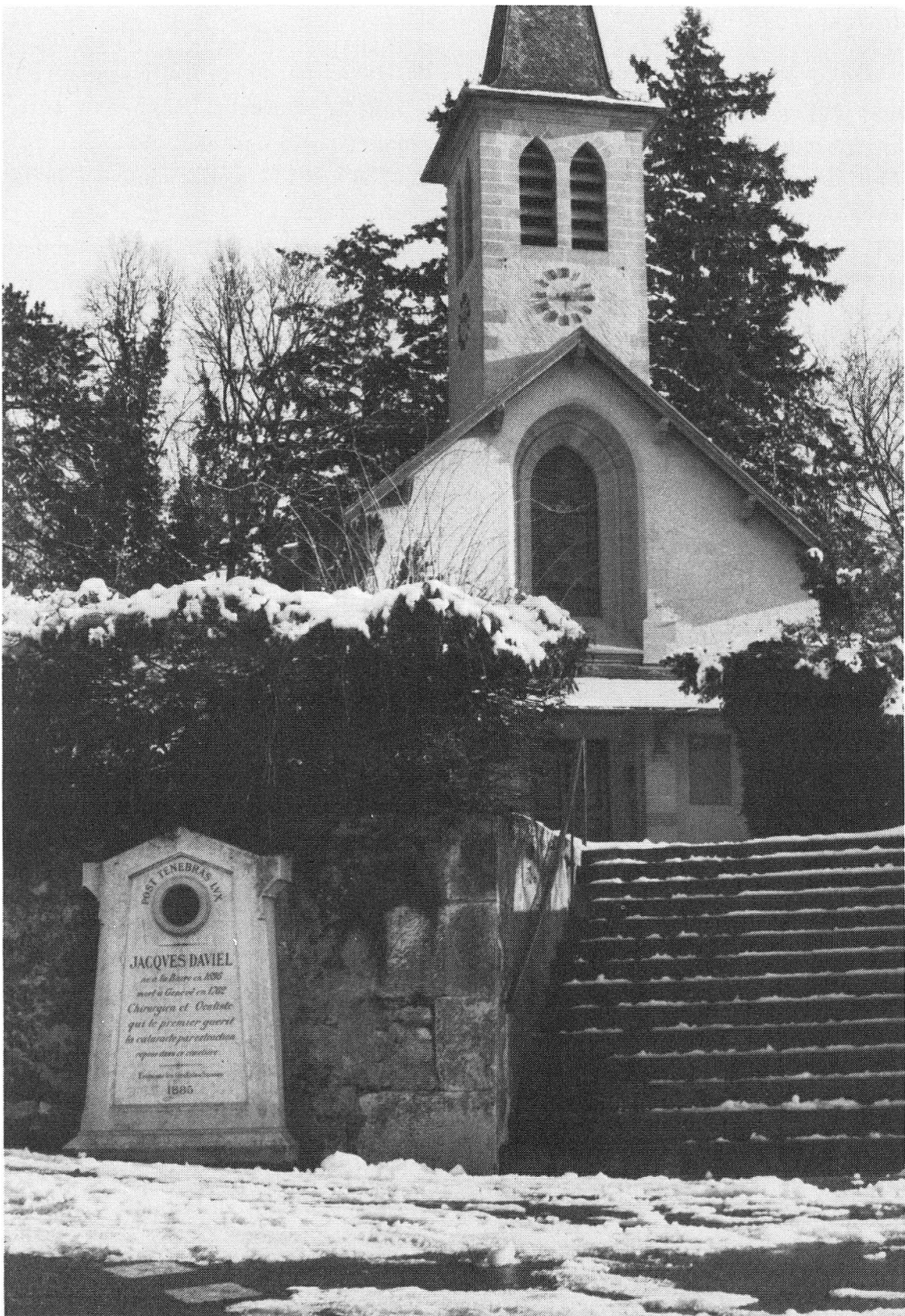
Fig. 4. Monument érigé par les ophtalmologues suisses (1885)