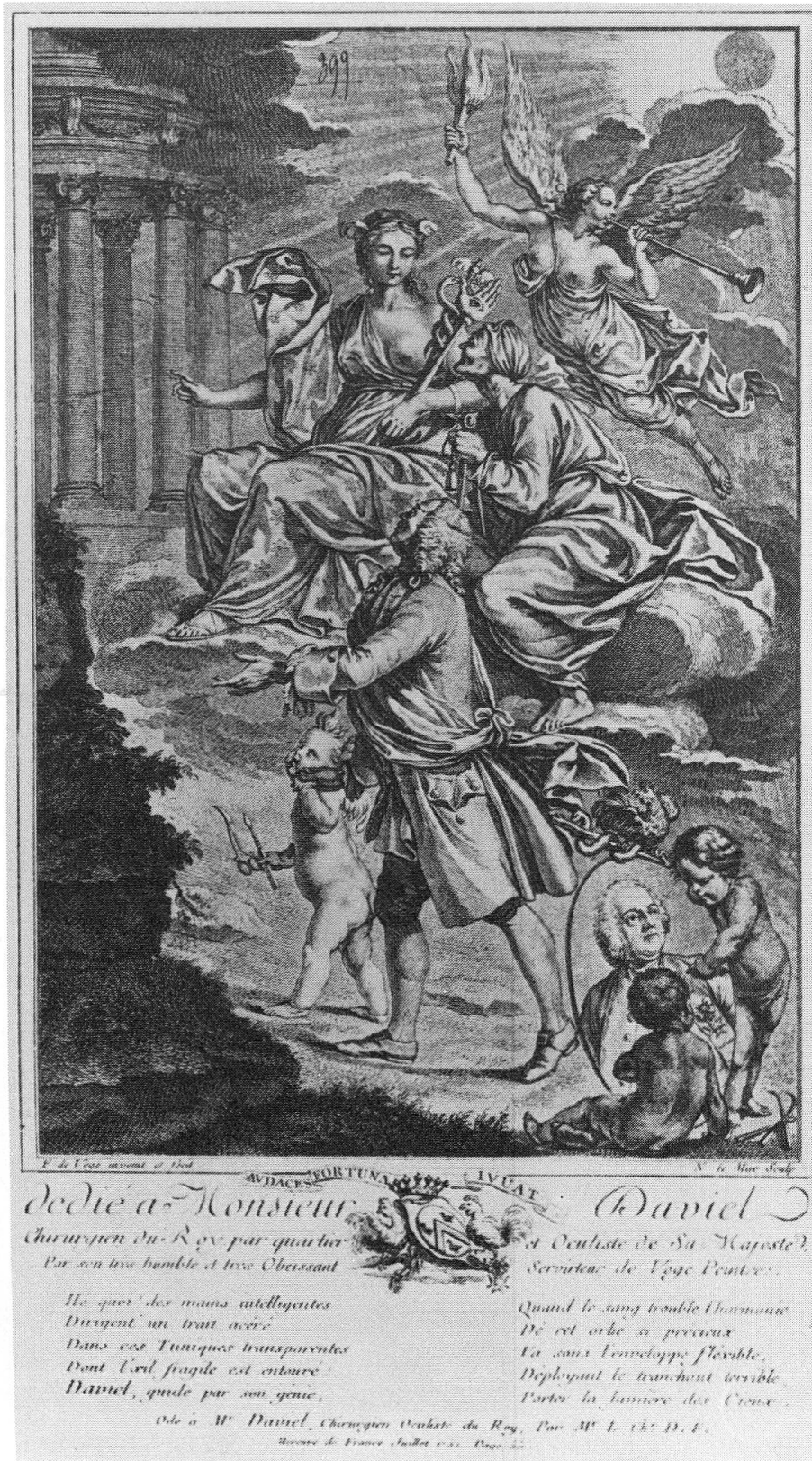
Fig. 2. Allégorie et ode parues au Mercure de France (1752)