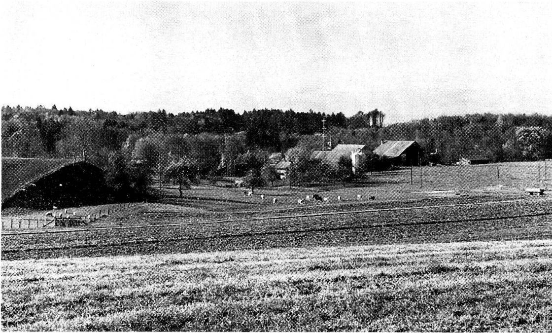
Abb. 2. Blick in die Mulde von Goumoens-le-Jux. In der Tiefe hinter dem Waldkamm fließt der Talent