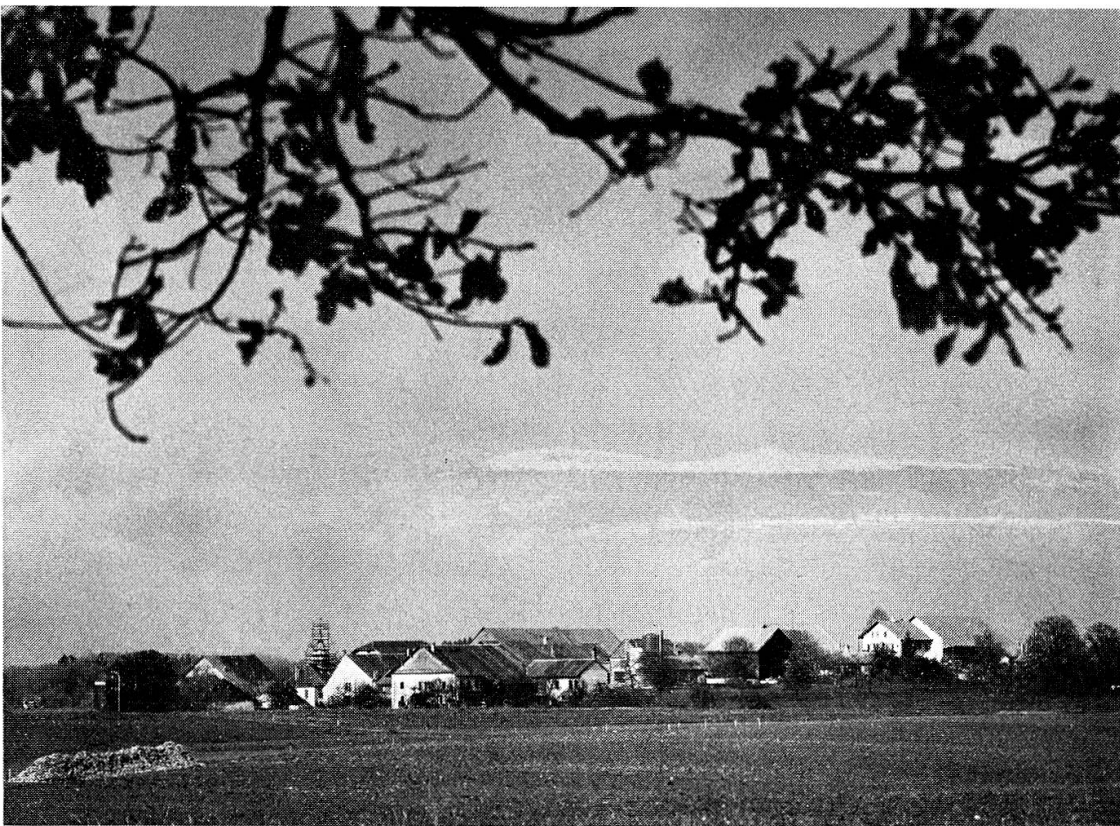
Abb. 3. Die Bodenwelle von Eclagnens.