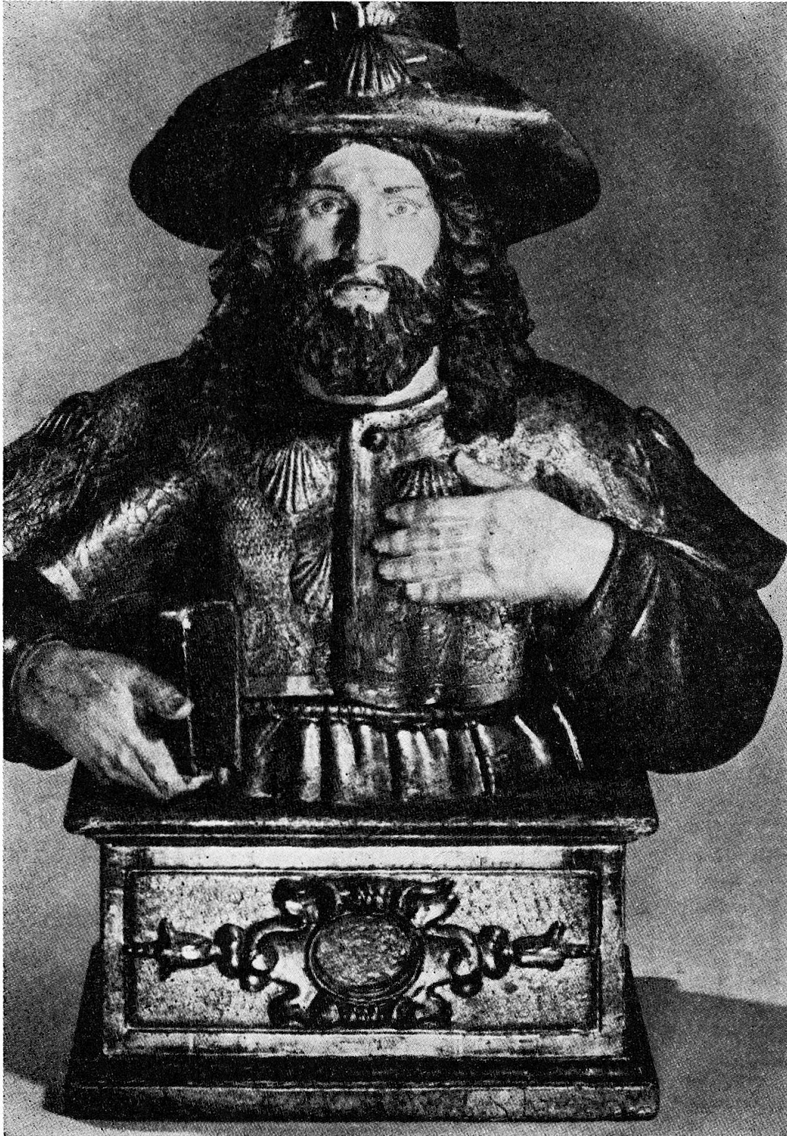
Fig. 5. Buste reliquaire de Saint-Jacques-de-Compostelle en bois doré, sur socle, Eglise de Cazères-sur-Garonne (H.-G.), reproduit d'après Pl. XII, Pèlerins et Pèlerinages dans les Pyrénées Françaises , Musée Pyrénéen, 1975