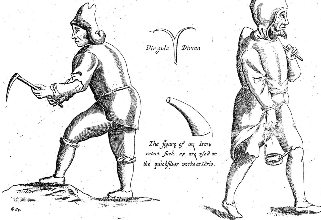
Abb. 2. Knappen in ihrer Arbeitskleidung (Idria)

Gelegenheit bot, oft selbst tief hinunter zu den Arbeitsplätzen. Dadurch wurde seine Berichterstattung authentischer, aber menschlich war sie, erstaunlicherweise, nur in geringem Maße engagiert. Er war weit mehr von den Einrichtungen und ihrem Funktionieren beeindruckt, als von der Härte und den Gefahren der Arbeit berührt, so daß wir uns fragen müssen, ob es sich da um eine gewollte «wissenschaftliche» Distanzierung handelte oder um ein Akzeptieren der damals selbstverständlich erscheinenden Rolle der Knappen im Sinne einer sozialen Notwendigkeit . Wir neigen mehr zu dieser zweiten Deutung, obwohl einige Autoren, die zum Teil noch vor Browne dieselben Bergwerke beschrieben haben, im Vergleich mit ihm mehr humanes und sozial-medizinisches Interesse am Schicksal der Grubenarbeiter gezeigt haben.