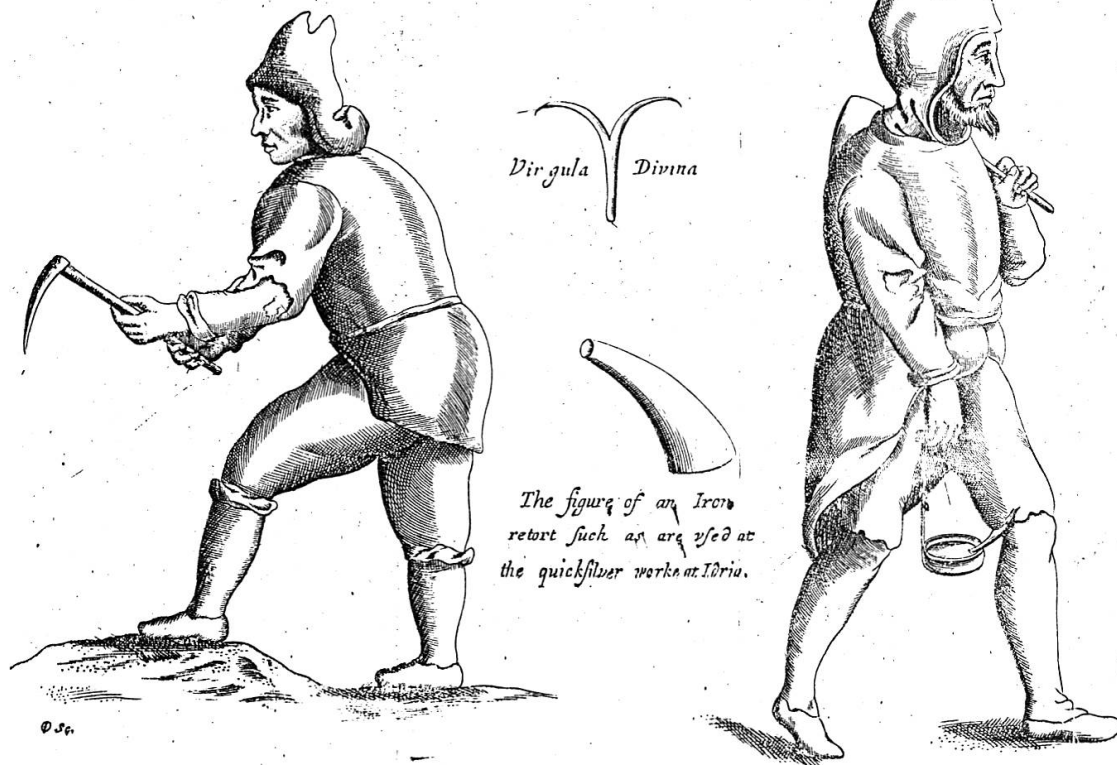
Abb. 2. Knappen in ihrer Arbeitskleidung (Idria)