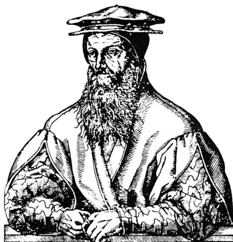
Konrad Gesner Arzt und Naturforscher in Zürich 1516–1565