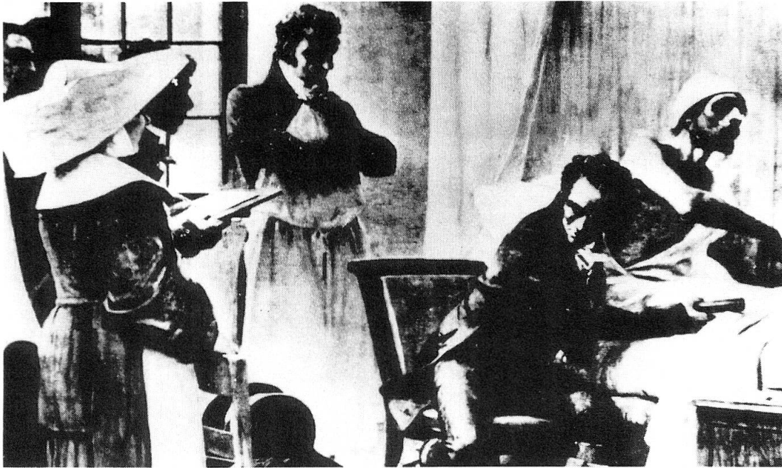
Abb.3. Laennec im Hôpital Necker untersucht einen Kranken mit Stethoskop (Gemälde von Th.Chartraud).

schau zu halten. Gerade Cabanis war es, der 150 Jahre nach Galileo, apertis verbis die Notwendigkeit unterstrich, die mit der Krankheit zusammenhängenden Fakten zu kennen und sich mit der Unkenntnis der «causae primae», «jener, dank derer wir leben», 31 abzufinden.