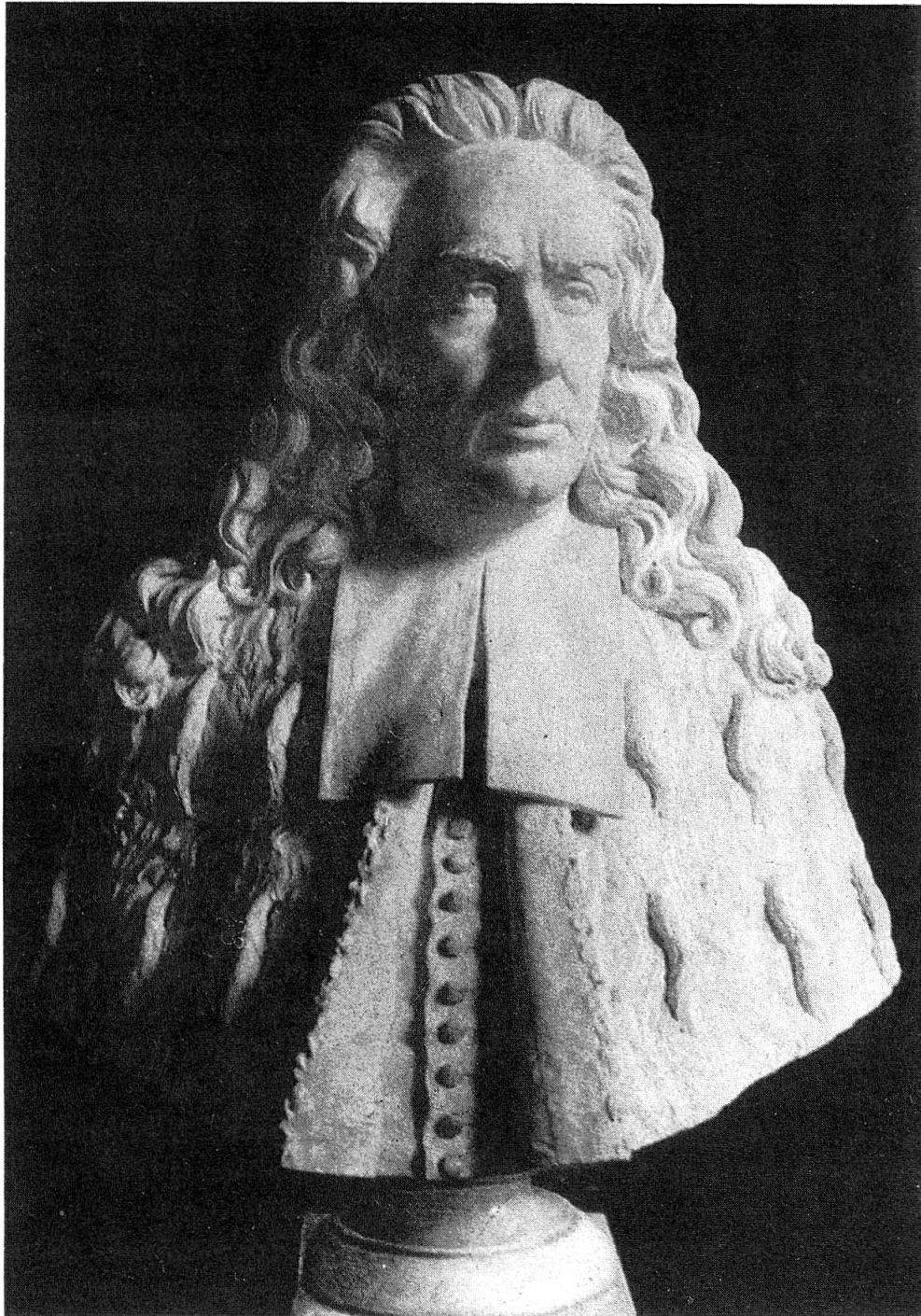
Abb. 1. G. B. Morgagni (die Büste, noch immer im Teatro Anatomico der Universität Padua vorhanden, die von der Natio Germanica dem alten Lehrer geschenkt wurde).