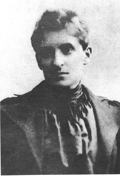
Abb. 8. Vor der Ausreise. 1897