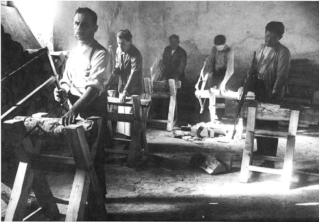
Abb.5: Arbeitstherapie für männliche Patienten, 1950er Jahre.

miteinander Heu einbrachten und Gemüse ernteten – wie grausam, wenn man sich dieselben Patienten tobend im Deckelbad vorstellt! Die Photographien aus über 100 Jahren zeigen, wie das Burghölzli langsam von der Stadt eingeholt und umschlossen worden ist – der lang hospitalisierte Patient vom Land, der auf dem Feld und im Stall zu brauchen war, ist verschwunden. Das Burghölzli hospitalisiert unter dem Druck der Aufnahmemöglichkeiten möglichst kurz; die Patienten sind Bewohner der Großstadt und ihrer Vorstädte; nur noch Schwerkranke oder allen Beziehungen Entfremdete treten ein, und sie werden so rasch wie möglich wieder entlassen. Das Asyl hat sich zum Kriseninterventionszentrum gewandelt.