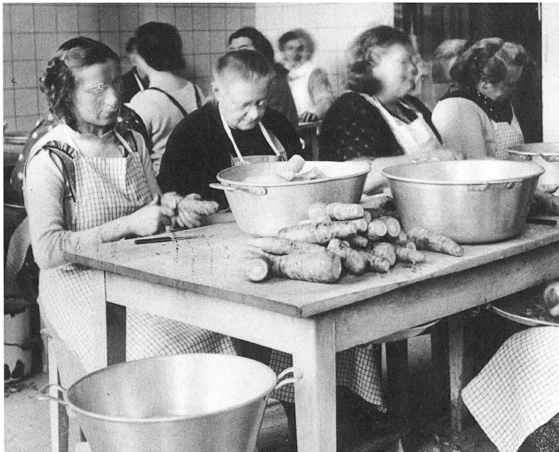
Abb. 4: Burghölzli-Patientinnen in der Gemüserüsterei, um 1940.

Museen beschäftigen sich mit der Vergangenheit – das Bild der Gegenwart trägt der Besucher in seinem Kopf. Ein gut gestaltetes Museum regt zu Vergleichen an. Die alte Psychiatrie erscheint sowohl idyllisch wie auch hilflos und dadurch grausam. Wie idyllisch, wenn Patienten und Pfleger