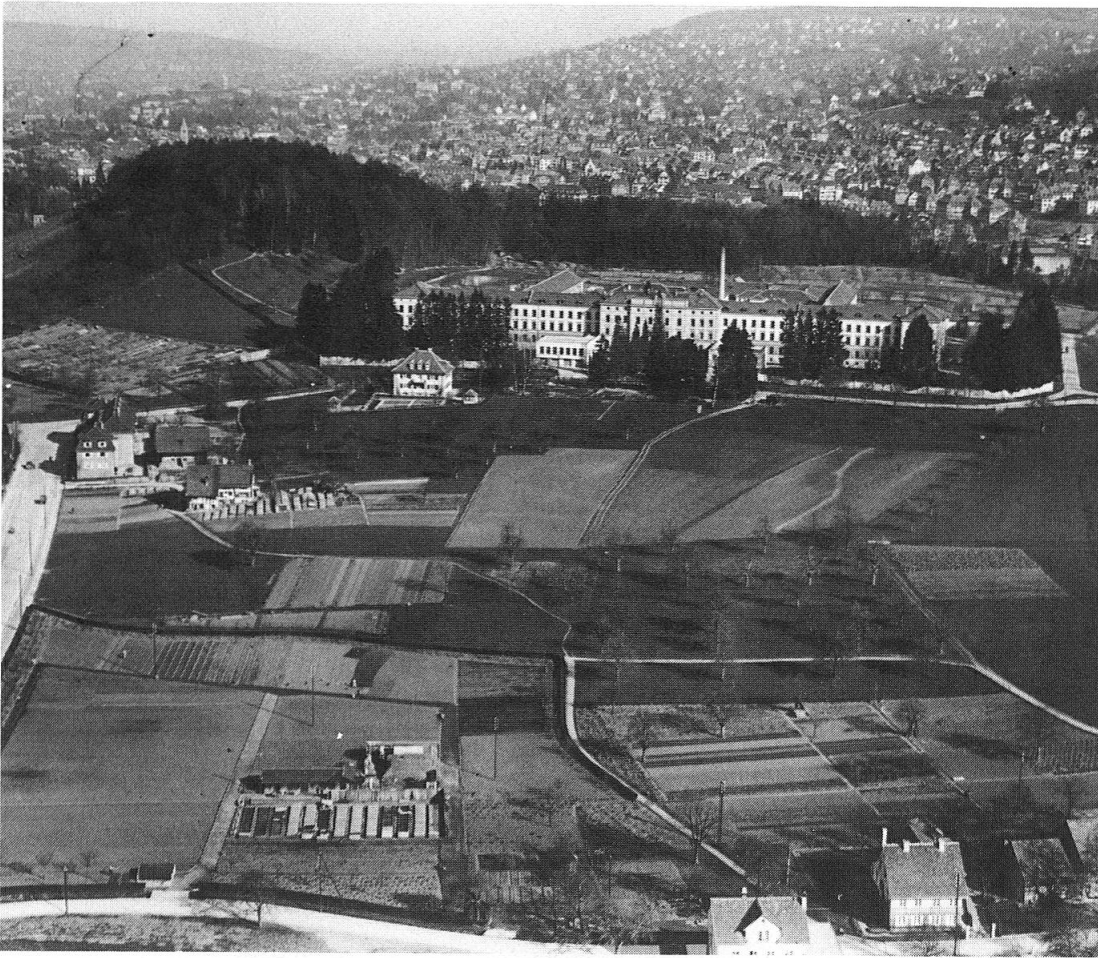
Abb.1: Durch den bewaldeten Hügel gegen die Stadt abgegrenzt, stand das Burghölzli noch 1934 in friedlich-ländlicher Umgebung.

In Holzschnitten und Schriften erscheint der Vorläufer: das alte Spital am Zürcher Predigerplatz, dessen Zwangsmittel und Zurschaustellung der Kranken gegen Mitte des letzten Jahrhunderts den Bürgern allmählich zum Ärgernis wurden. Überall entstanden damals Irrenanstalten. Die Planung einer Anstalt, entfernt von der Stadt, umgeben von Feldern, Wiesen und Zugängen über Schotterwege, dauerte fünfzehn Jahre – der Bau elf Monate. Eine Seilbahn führte das Material vom See herauf, und für 2,2 Millionen Franken entstand 1870 in strenger Symmetrie ein Haus, welches von den Zeitgenossen – will man den Darstellungen glauben – als majestätischer Palast empfunden wurde. Die Hierarchie einer streng zentralisierten Anlage in der demokratischen und föderalistischen Schweiz! Die Muschel im Giebel des Mittelbaus erinnert an die Fürstenschlösser des 18. Jahrhunderts.