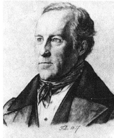
Abb. 1: Carl Gustav Carus (1789–1869) im 49. Lebensjahr