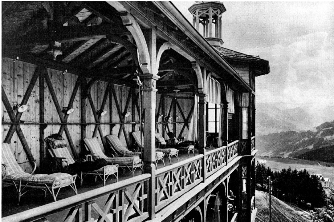
Fig.3 Galerie de cure du Sanatorium du Chamossaire construit en 1906 (aujourd'hui démoli). Quelques exemples remarquables de cette architecture sont conservés, parmi lesquels le Sanatorium du Grand Hôtel (1892, 1906) et Les Frênes (1909). [Album de photographies, Musée de l'Elysée]

cure de travail, Rollier ayant lutté contre le désœuvrement parfois dramatique des malades.