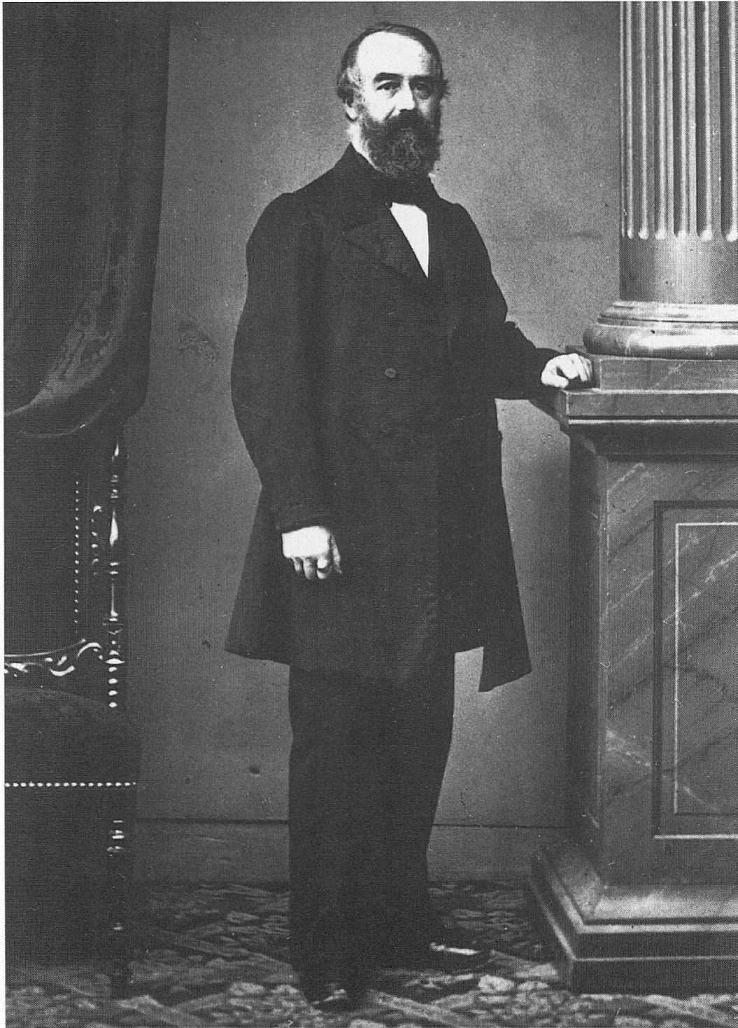
Rudolf Wolf als wohlbestallter Professor für Astronomie am Eidgenössischen Polytechnikum (heute Eidgenössische Technische Hochschule) und an der Universität Zürich (Atelieraufnahme um 1860 :)