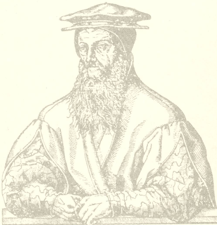
Conrad Gessner 1516–1565

Swiss Journal of the History of Medicine and Sciences Vol. 54 (1997) N° 1/2