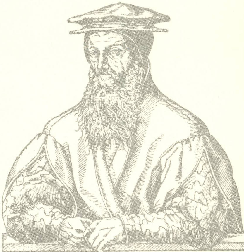
Conrad Gessner 1516–1565

Swiss Journal of the History of Medicine and Sciences Vol. 57 (2000) N° 1/2