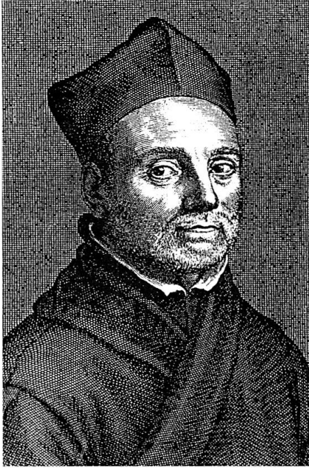
Abb. 1. P. Athanasius Kircher SJ.

die Diatribes de prodigiosis crucibus und 1663 die Polygraphia nova et universalis , ein Jahr später Mundus subterraneus I, der zweite Teil erschien 1665. Ein Jahr später publizierte er Obelisci aegyptiaci interpretatio . Das Werk China illustrata veröffentlichte er 1667 in Amsterdam und im selben Jahr Magneticum naturae regnum in Rom. 1668 erschien in Würzburg das Organum mathematicum . 1669 wurde in Amsterdam die Ars magna sciendi gedruckt. 1673 publizierte er die Phonurgia nova . Da er von vielen Besuchern bedrängt wurde, floh Kircher nach Mentorella, er wurde auch dort mit Briefen überhäuft. 1675 wurde in Amsterdam die Arca Noe gedruckt und 1676 Sphinx mystagoga sive diatribe hieroglyphica . In Amsterdam er-