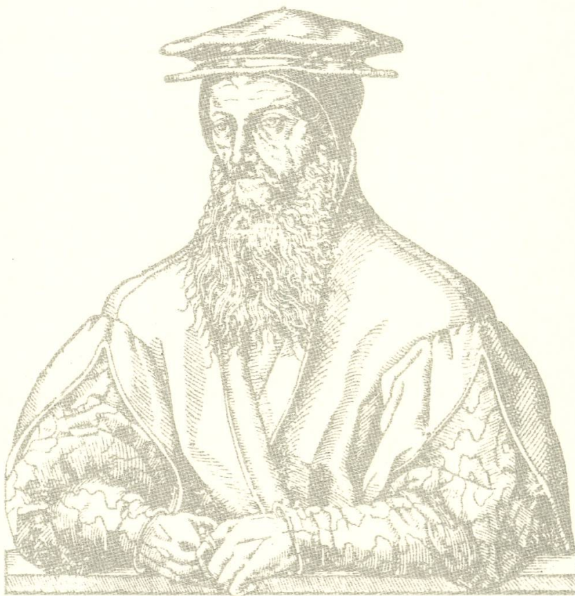
Conrad Gessner 1516–1565

Swiss Journal of the History of Medicine and Sciences Vol. 57 (2000) N° 3/4