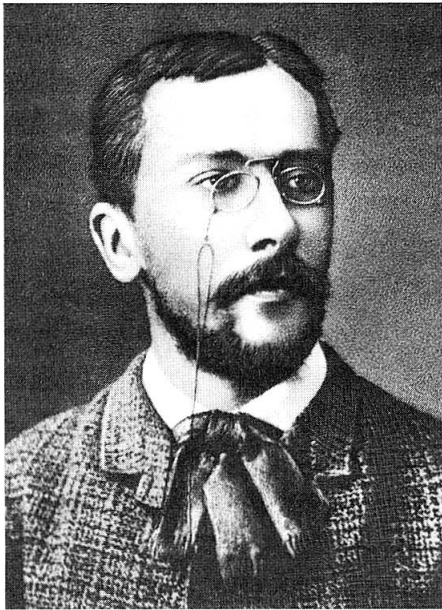
Abb. 1. Konstantin Sergeevič Merežkovskij (1855–1921). Aus: Höxtermann 1998, 11.

Im Jahr 1878 fand in Kassel die 51. Versammlung der deutschen Naturforscher und Ärzte statt, auf der der Strassburger Botaniker Anton de Bary (1831–1888) den Begriff Symbiose als eine «Erscheinung des Zusammenlebens ungleichnamiger Organismen» prägte 1 . 30 Jahre später übertrug der russische Zoologe und Botaniker Konstantin Sergeevič Merežkovskij das Symbiosekonzept von der Entwicklungsgeschichte auf die Stammesgeschichte und begründete mit seiner Theorie der Symbiogenesis eine neue Lehre von der Entstehung der Organismen 2 . Es sollten weitere 60 Jahre vergehen, bis im Ergebnis molekulargenetischer Befunde die amerikanische Zellbiologin Lynn Margulis (geb. 1938) die Symbiogenesetheorie neu