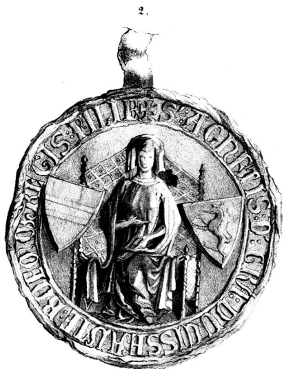
1291, 50 Augstm.