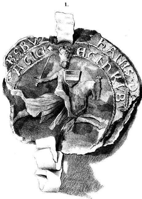
1507, 24 Winterm.