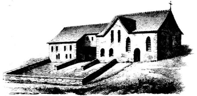
Von der Südlichen Seite, mit dem ehemaligen Kloster.