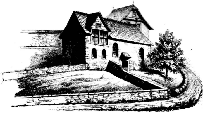
Von der Westlichen Seite, wie sie jetzt ist.

aufgenommen v. Jng r . Schwyzer, Vereins-Mitglied.