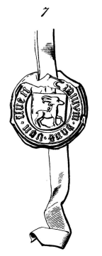
1468, 21 Brachw.