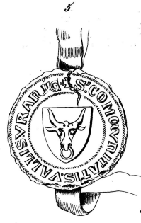
1399, 18 Augotw.