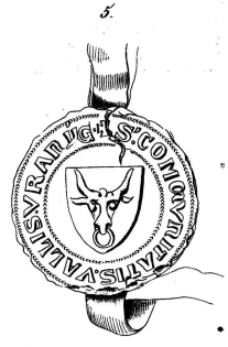
1399, 18 Augustus.