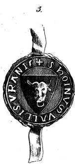
1258, 20 Mai.