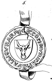
1399, 18 August.