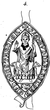
1252, 18 Wien.

4 Cum omnibus adiacentibus velus pertinentiis suis situlandis fir fundacionibus. Ad hoc pagellum utonue cum delectis domibus. Et quibus adiacentibus 7 desuper posuit munus utrius que sexus de acanis. acerris dulcis et in labris. sicut prius postuit. equis equitibus de curibus adiacentibus 7 per unum scilicet de regentibus quatuordecim. tenent cum uniuersis tenentibus. Adiacentibus pertinentiis suis