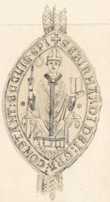
1257, 2 Brachm.