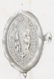
1376, 12. März