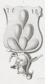
1538, 40. April