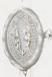
1376, 12. Hara.