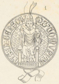
1436, 28 Brachm.