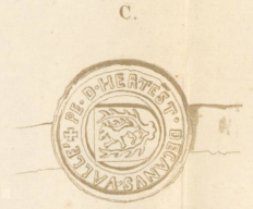
1502, II. Winterm.