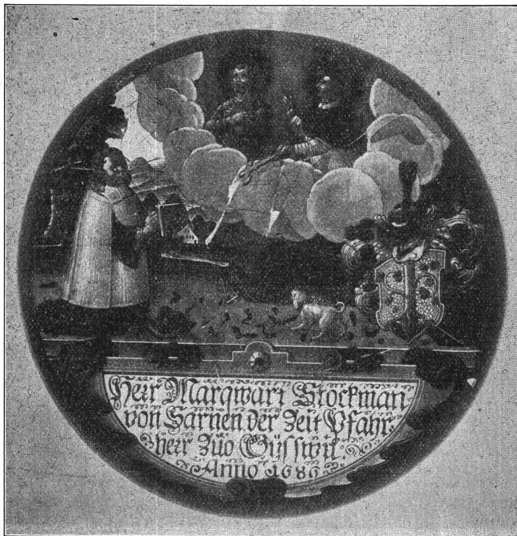
Gebrochenes Figurenscheibchen in Privatbesitz zu Kerns.

göttlicher Gnaden durch ordenliche Wal zu Bäpstlicher Administration kommen und von derselben nächsten Blutsverwandten, jetz sin Fürstlich Gnaden, vernomen, das Ir Gnad zu geistlichem Stand begirig, da habe Ir Heyligkeit alle gnädigste Befürderung dartzu gethan.“ Unter den nämlichen Tagherren