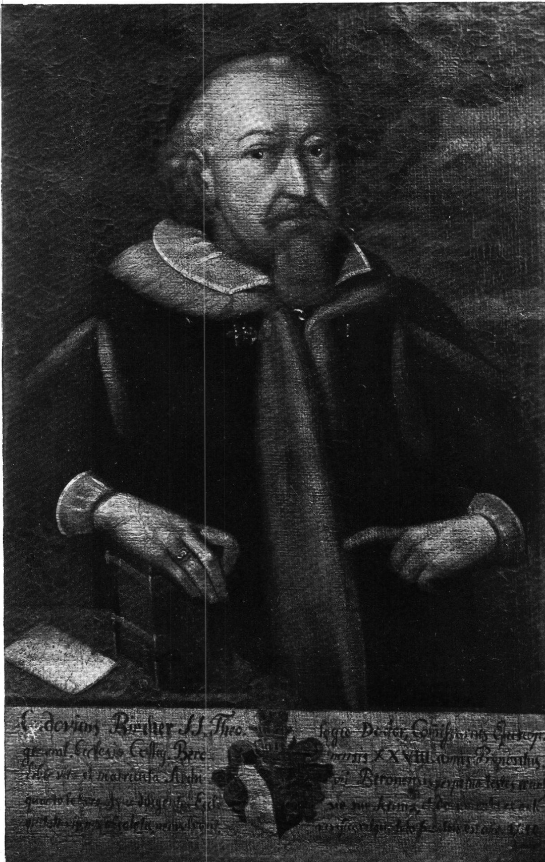
Propst Ludwig Bircher Nach dem Portrait auf der Luzerner Bürgerbibliothek.