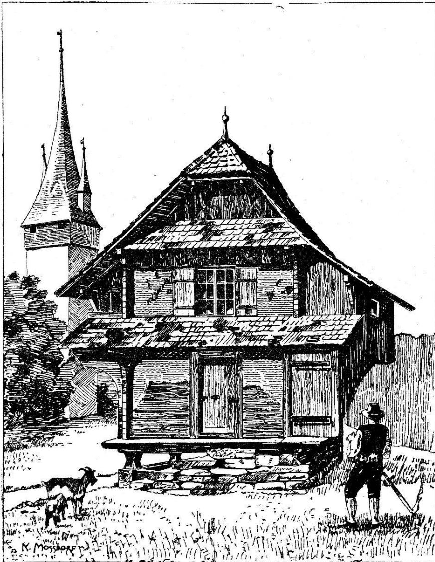
Der alte Wachturm „Luoginsland“ (Musegg).

Städten auch anderwärts nachweisbar sind, oder als Überrest der ältesten Stadtanlage Luzerns. Dieser Wachturm inmitten der Stadt, in Verbindung mit anderen Türmen (auch solchen auf der Musegg vor Erbauung der Mauer 1408), konnte für die älteste Zeit genügen. Aber nach der Sempacherschlacht drang die Kunde von der Vernichtung