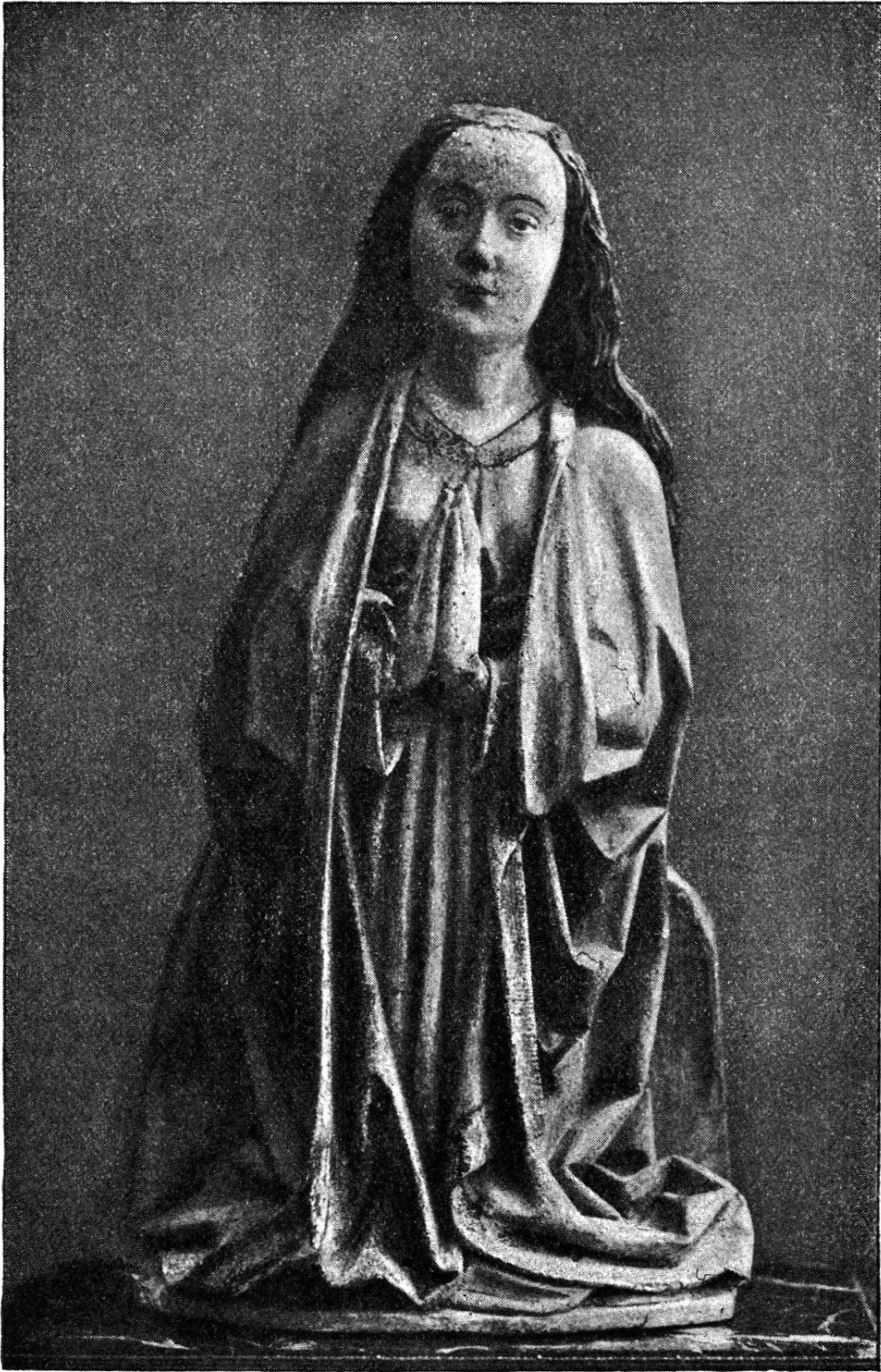
Holzgeschnitztes Marienbild von Nottwil, um 1495.