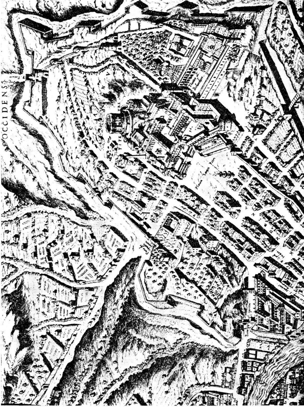
Der Vatikan und Teile der Leostadt aus der Vogelperspective

(nach dem Prospect von Du Pérac-Lafréry)