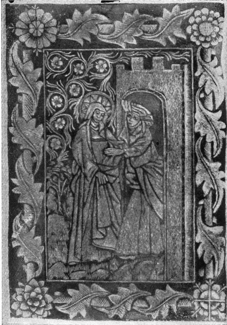
Teigdruck aus Beromünster.