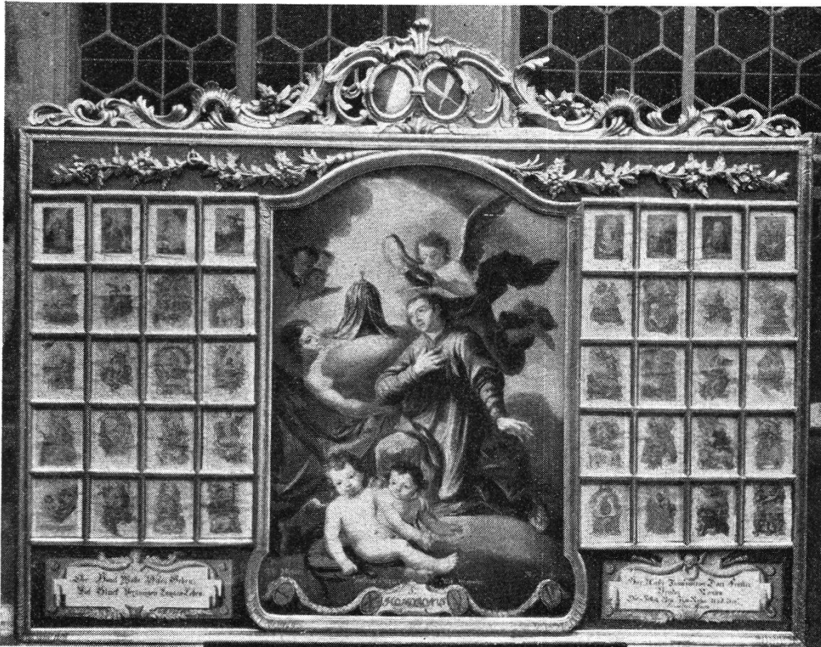
Die ehemalige Wappentafel im Zunftsaal