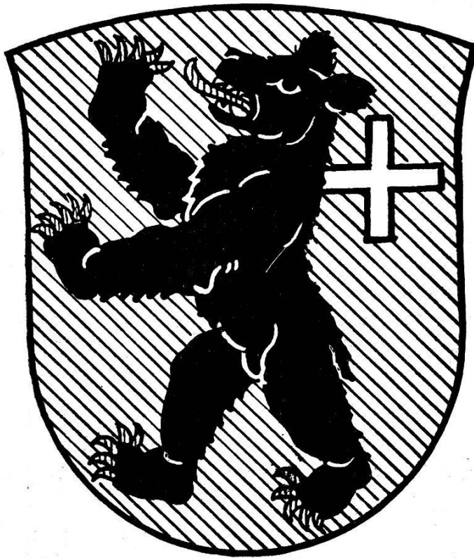
Das Wappen von Ursen.

Andere Kindvogtrechnungen stehen gelegentlich mitten in den Talrechnungen, z. B. 1497.