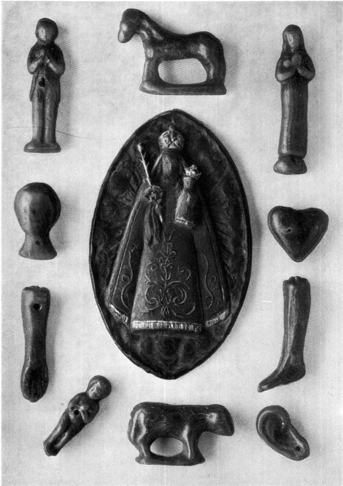
Votivfigürchen aus Wachs