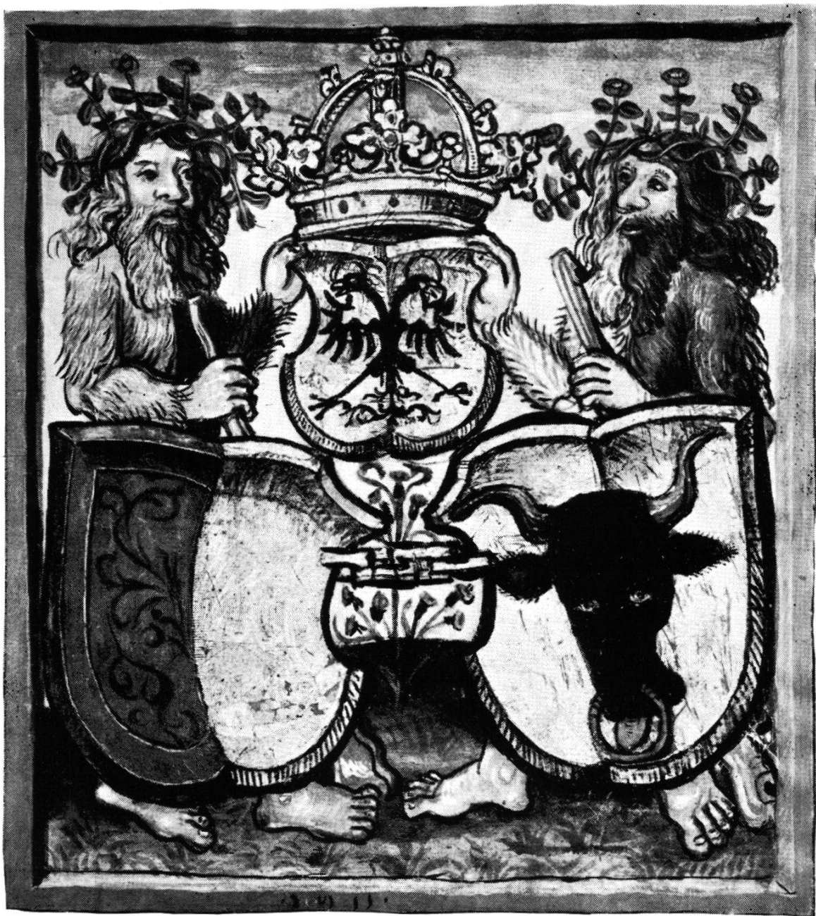
Das 1511 erneuerte Arbedo-Denkmal Diebold Schilling-Chronik