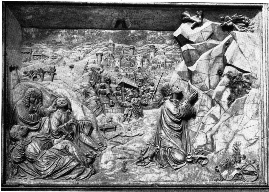
Das Ölberg-Relief von c. 1513 auf der südlichen Außenseite der Peterskapelle