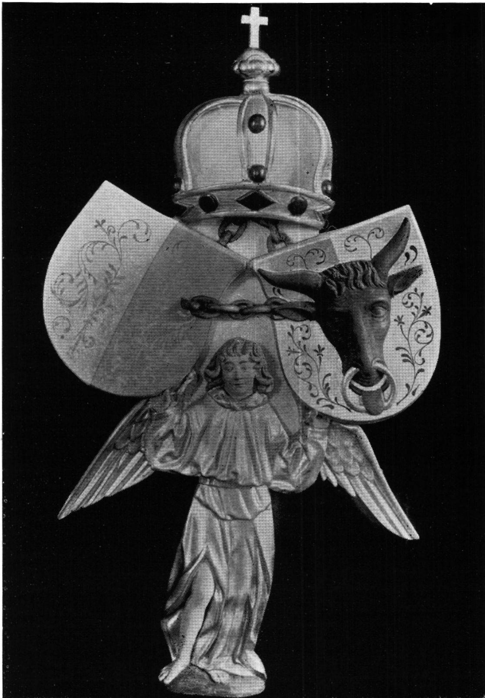
Das dritte Arbedo-Denkmal an der Orgel Empore