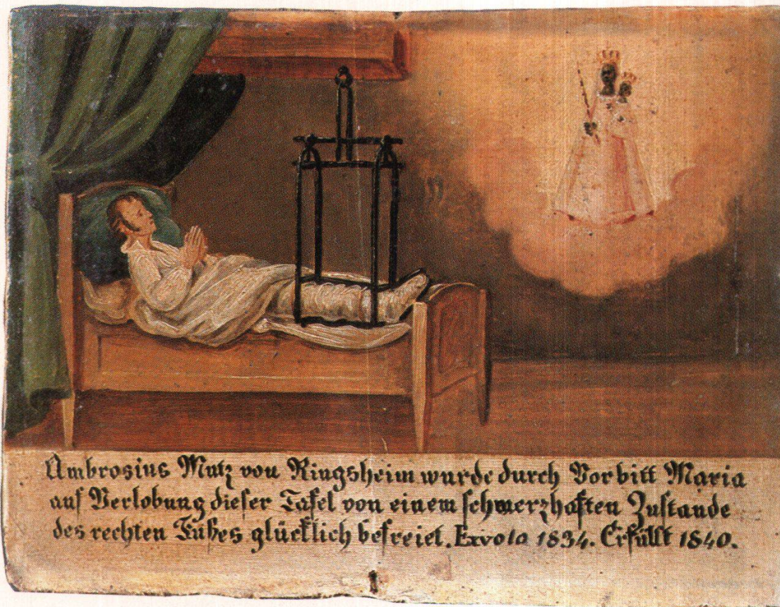
Abb. 11 Krankenlager (Leiden am Fuss), Muttergottes, Klosterkirche Einsiedeln, Öl/Holz, 22 x 27 cm, 1840.