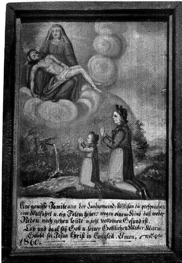
Abb. 7 Verlöbniß eines Kindes, Pieta, ehemals Kloster Werthenstein (Kt. Luzern), Öl/Holz, 38.5 x 28 cm, 1860.

Plastische geformte Augen oder Augenpaare sowie runde Augäpfel verweisen wie isoliert stehende Augen auf Votivbildern auf Augenkrankheiten oder Blindheit 168 .