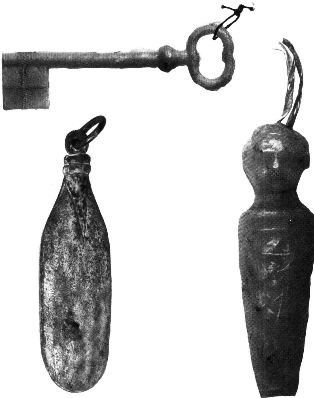
Abb. 6 Schlüssel, Beutelvotiv, Wickelkind

Schlüssel, Medizinhistorische Sammlung Zürich (aus Stans, Kt. Nidwalden, herstammend), Wachsguss, 11 cm.