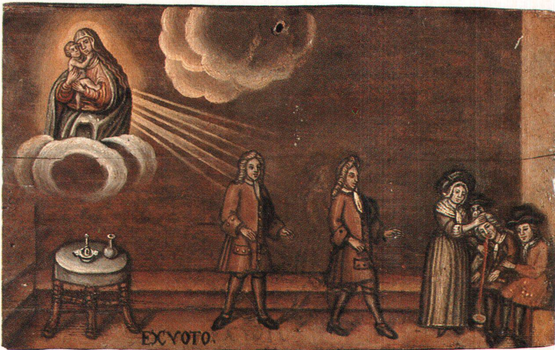
Abb. 4 Blutsturz, Maria Hilf, Kapelle Maria Hilf, Stoos (Kt. Schwyz), Öl/Holz 24.7 x 40 cm, anfangs 18. Jahrhundert.

Kurpfuscherei 83 . Seit 1596 mussten sich in Luzern einheimische und fremde Scherer und seit 1675 auch die Ärzte Medizinalprüfungen unterziehen 84 . Trotzdem zogen noch bis zum Anfang des 18. Jahrhunderts fahrende Mediziner durch die Lande und suchten als «Wunderdoktoren» oft zusammen mit Gauklern und Possenreissern ihr Glück 85 .