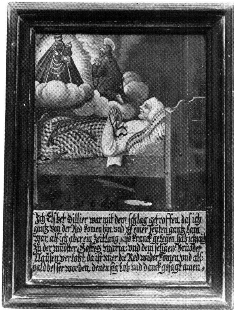
Abb.12 Apoplexie (Halbseitenlähmung), Muttergottes und Bruder Klaus, ehemals Dorfkapelle Sarnen (Kt. Obwalden), Öl/Holz, 25 x 17 cm, 1665.

Einsiedeln ist als Opfergabe ein goldenes Schienbein erwähnt, welches mit so vielen Diamanten besetzt war, wie Knochensplitter aus der Wunde gingen 242 . Ab und zu stossen wir auf Votivgaben, welche kranke Gliedmassen darstellen (verkrüppelte Arme und Beine, eingezeichnete Wunden und Geschwüre) 243 .