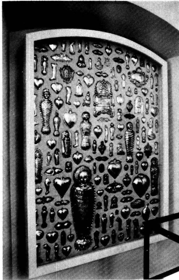
Abb. 2 Votivgaben am Grabe des hl. Bruder Klaus, Sachseln (Kt. Obwalden).

Als Unterlagen für die Inschriften und Malereien wurden neben Papier und Karton 53 auch Blech 54 und Marmor 55 verwendet.