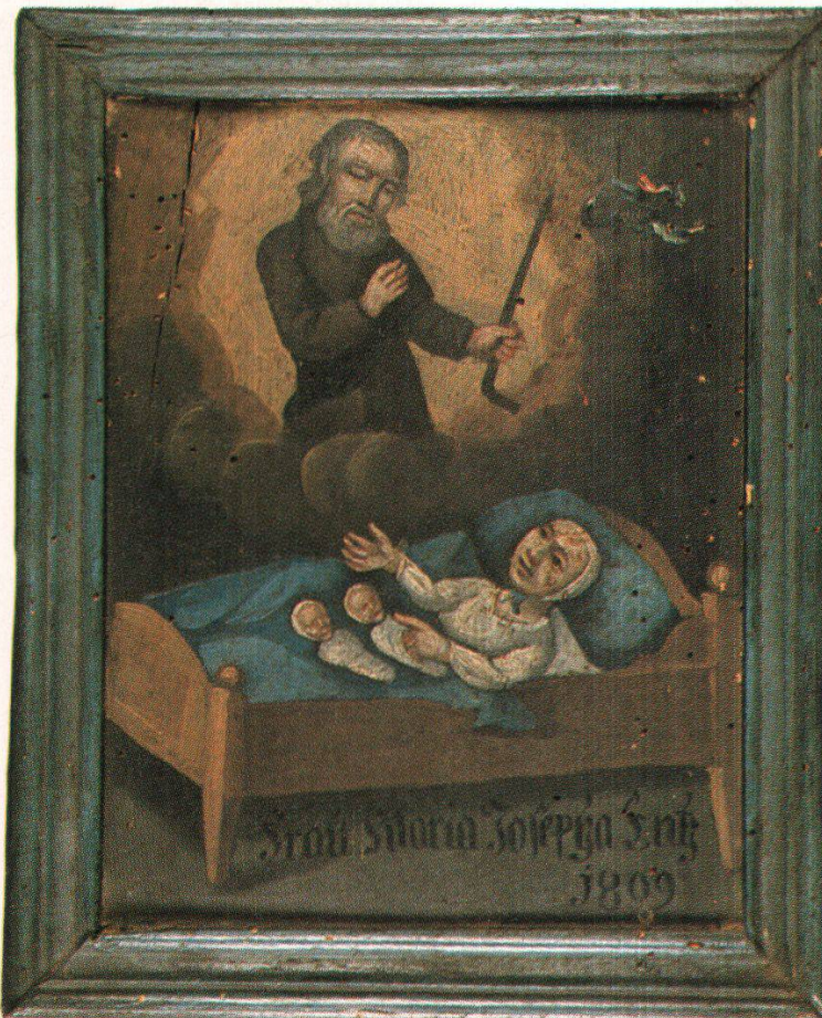
Abb. 5 Zwillingsgeburt, hl. Beat, Beatuskapelle Obsee (Kt. Obwalden), Öl/Holz, 15 x 18 cm, 1809.

Nicht immer kamen Mutter und Kind mit dem Leben davon. Ein «häufig auftretendes Kindbettfieber», an welchem offenbar viele Mütter starben, war Anlass für die Opferung einer Tafel in die Jagdmattkapelle 108 .