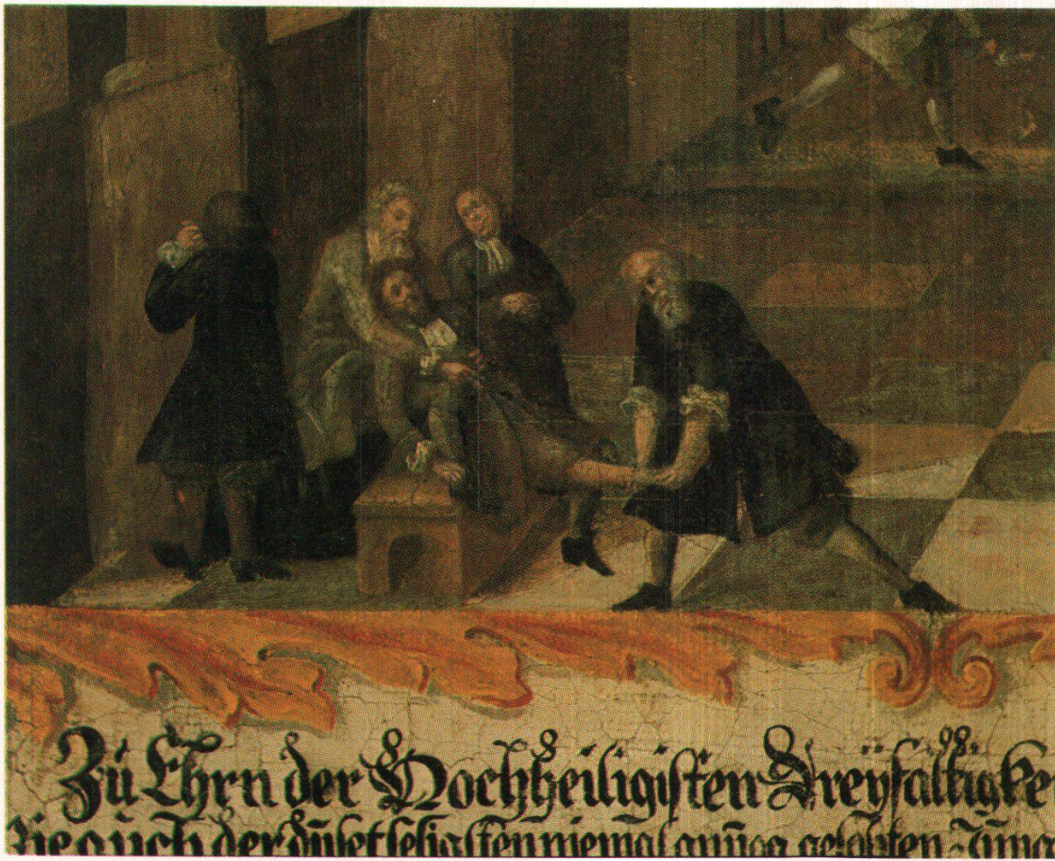
Abb. 3 Beinbruch, Lorettkapelle Hergiswald, Öl/Leinwand, 70 x 55 cm, 1684, (Ausschnitt).