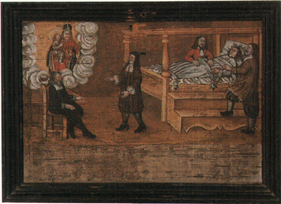
Abb. 15 Geisteskranker, Muttergottes, Kapelle Niederrickenbach (Kt. Nidwalden), Öl/Holz, 23 x 34 cm, undatiert.