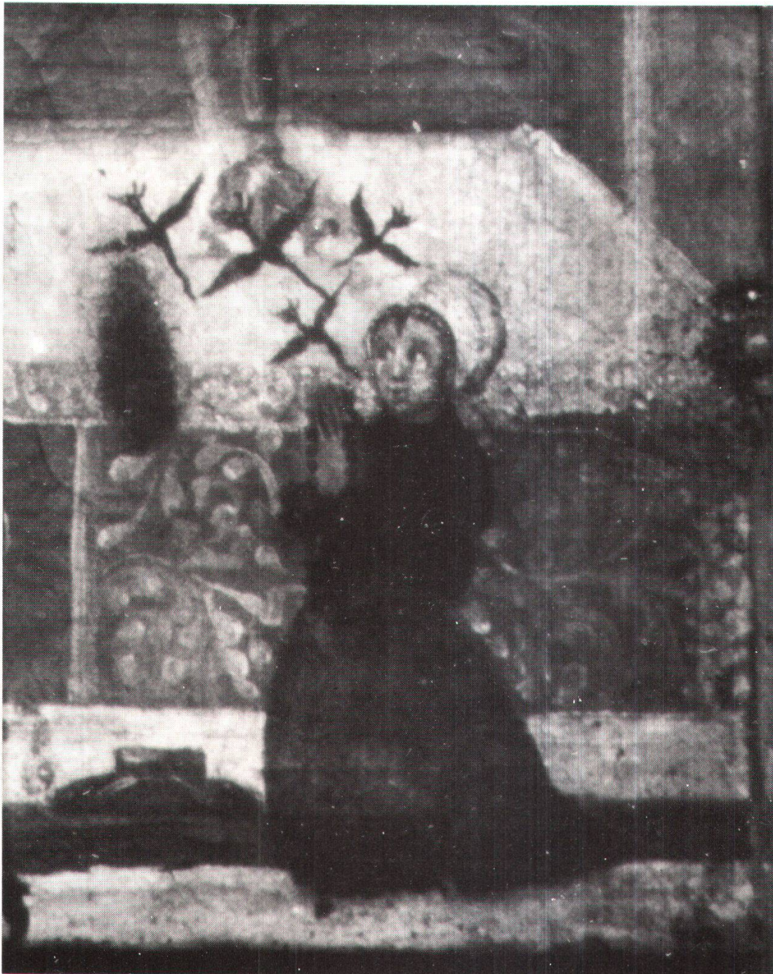
Abb. 14 Besessene, ehemals Pfarrkirche Gonten (Kt. Appenzell), Öl/Leinwand, 36 x 26 cm, undatiert (Ausschnitt). Aus dem Munde der Frau fahren Dämonen in Gestalt von geflügelten Wesen aus.