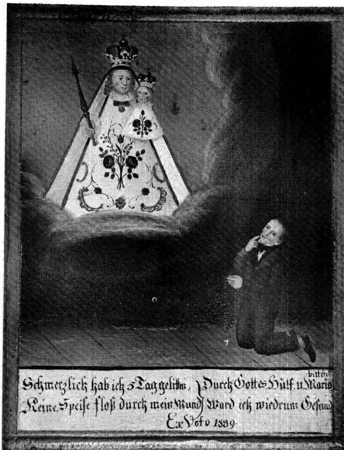
Abb. 9 Krankheit im Mund oder Hals, Muttergottes, ehemals Kapelle Niederrickenbach (Kt. Nidwalden), Öl/Holz, 30 x 23 cm, 1839, gemalt von Alois Niderberger.

mer Weise die Zähne ausgeschlagen wurden. Abgebildet wird sie meist mit einer Zange, mit der ein ausgerissener Zahn gehalten wird 187 .