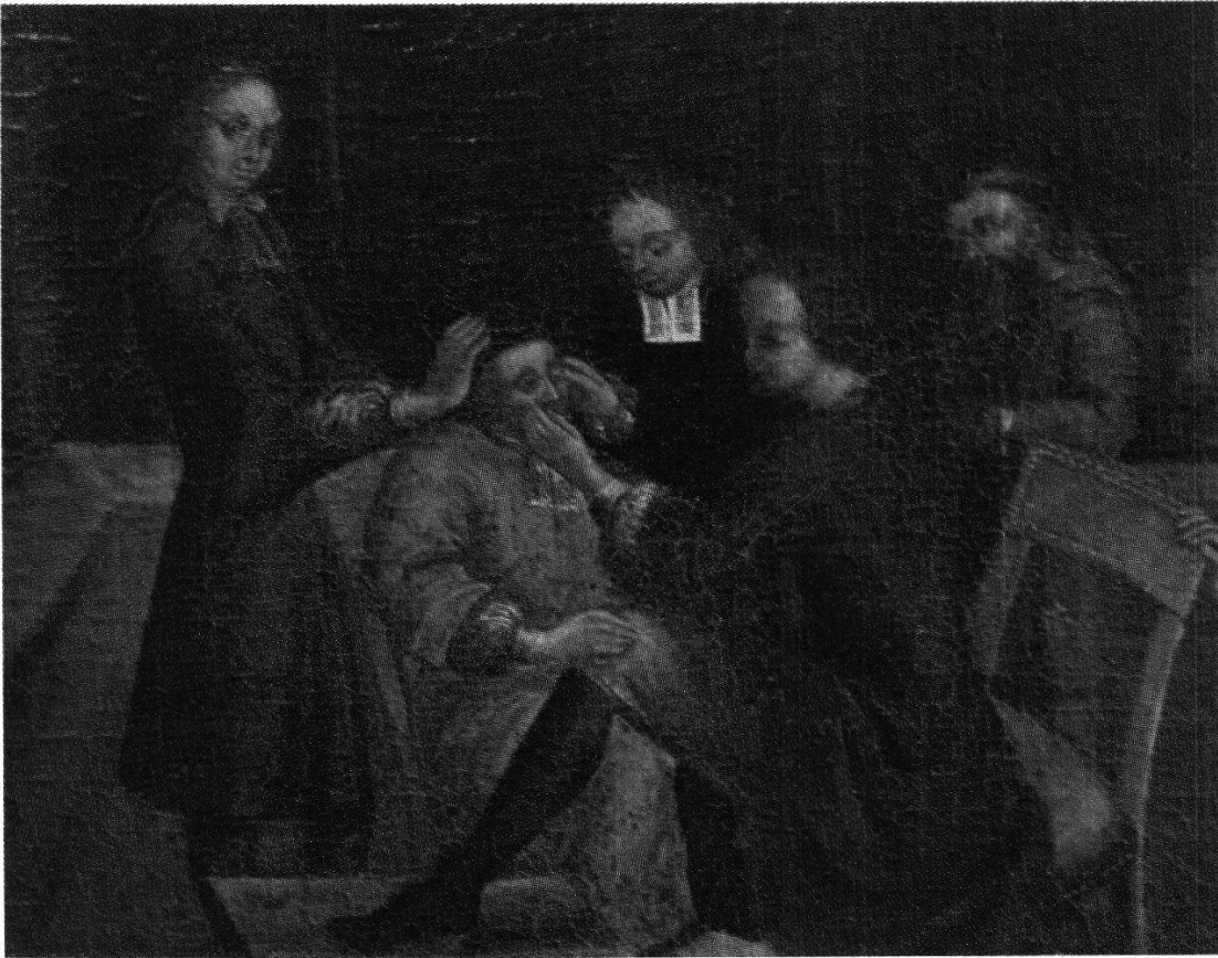
Abb. 8 Staroperation, St. Antoniuskapelle Immenfeld, Schwyz, Öl/Leinwand, 59 x 71 cm, anfangs 18. Jahrhundert (Ausschnitt).

Die während Jahrhunderten wichtigste augenärztliche Operation, der Starstich, wurde vielfach von fahrenden Starstechern ausgeführt 180 . Dass darunter auch tüchtige Leute waren, beweisen zwei Operationen, die an Landammann Johann Dominik Betschart (1656–1736) aus Schwyz mit Erfolg durchgeführt wurden 181 .