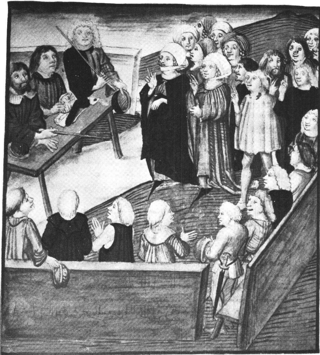
Abb. 7 Die Damen der Tvingherren vor dem Rat (Berner Schilling, Bd. 3, S. 100)

Rechte der alten Feudal- und Grundherren eintraten, den Untertaneneid zu leisten, was hier im Falle der Haslitaler, beziehungsweise der Märchler Bauern überliefert wird 54 .