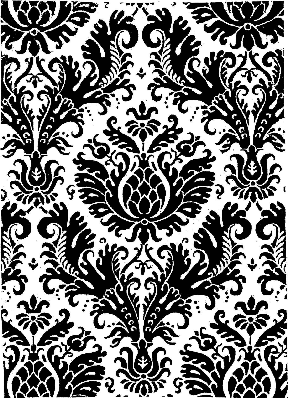
Abb. 1: Seidengewebemuster des 17. Jahrhunderts (Schwarz-Weiss-Zeichnung Robert Ludwig Suter).