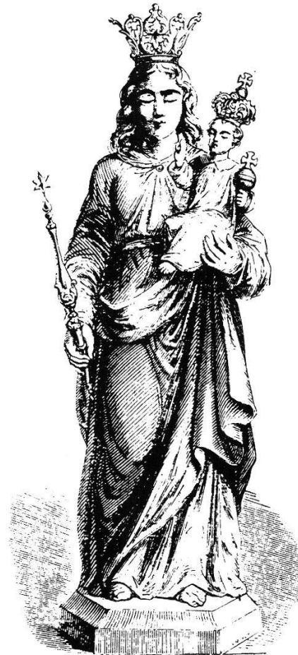
Abb. 249 (oben rechts): Notre-Dame de Montaigu (Scherpenheuvel, Belgien), Wallfahrts- und Pfarrkirche. Gotische Plastik, stehende Muttergottes mit Kind, seit dem Barock mit einem Stoffbehang bekleidet und ohne diesen auf keiner Abbildung erhältlich, weshalb hier die Zeichnung einer Kopie in Grand-Bigard (Brabant, Belgien) reproduziert ist.