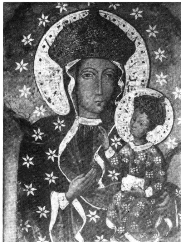
Abb. 253: Madonna von Tschenschow (Polen), Wallfahrtskirche. Bis auf die Gesichter und Hände mit Metall und Stoff verkleidete Marienikone. Die Datierungen schwanken von frühchristlich bis 15. Jh.; technischen Untersuchungen zufolge soll die Ikone nicht nach dem 9. Jh. entstanden sein. Anstelle des Originals ist hier eine Kopie im Benediktinerkloster Engelberg OW abgebildet.