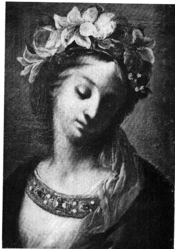
Abb. 250 (rechts): Mutter der Schönen Liebe , Wessobrunn (Deutschland), ursprünglich in der Kirche des Benediktinerklosters, seit dessen Abbruch 1810 in der Pfarrkirche St. Johannes. Brustbild einer Immaculata (unbefleckte Braut des Heiligen Geistes), angeblich von einem benediktinischen Klosterbruder namens Innozenz Mezzi (Metz) im Kloster Prüfening bei Regensburg gemalt, Anfang 18. Jh.