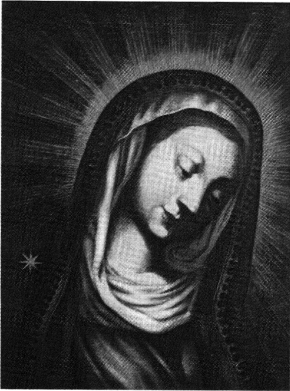
Abb. 251: Mutter mit dem geneigten Haupt, Landshut (Deutschland), Ursulinenkirche. Knappes Brustbild Mariens, Kopie des gleichnamigen Gnadenbildes in Wien, um 1680 von einem Wiener Künstler gemalt und mit dem Original berührt. Verbreitung vor allem durch die Ursulinen; gemalte Kopien sind selten, Kupferstiche dagegen zahlreich verbreitet.