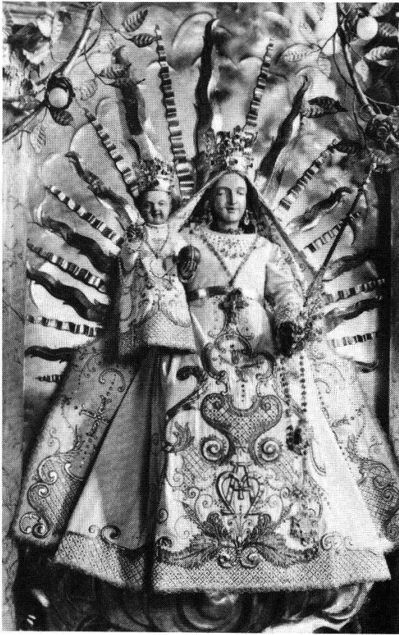
Abb. 245 (links): Maria Stein SO, Benediktinerkloster, Gnadenkapelle. Statue Maria mit Kind, Stein, vermutlich um 1650, heute noch mit textilen Prunkgewändern bekleidet.