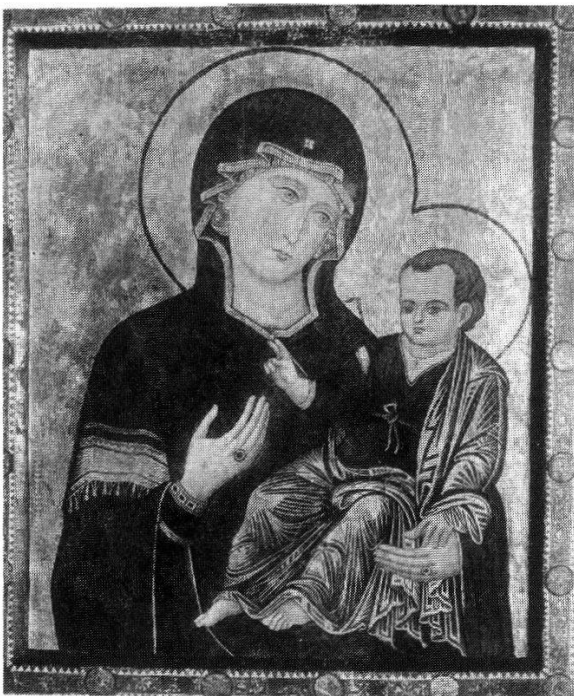
Abb. 252 (links): S. Maria del Popolo, Rom (Italien), in der gleichnamigen Kirche. Tafelbild mit einer Darstellung der Madonna mit Kind vom Typus der Hodegetria. Byzantinisierende Ikone, nach der Tradition 1231 zur Bekämpfung der Pest in einer Bittprozession aus der päpstlichen Kapelle Sancta Sanctorum in die Kirche S. Maria del Popolo überführt. Das heutige Gemälde wird ins ausgehende 13. Jh. datiert und ersetzte eventuell ein älteres Bild byzantinischer Herkunft.