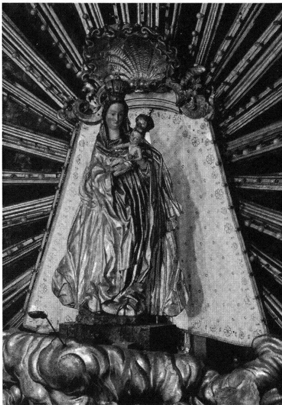
Abb. 247 (unten): Maria Waldrast im Tirol (Österreich), Wallfahrts- und Servitenklosterkirche. Gotische Holzfigur, sitzende Madonna mit dem Jesusknaben; im Barock mit kostbaren Stoffgewändern bekleidet. In einem solchen Stoffgewand ist sie auch auf der einzigen bekannten, nur in Form eines Kupferstichs überlieferten Kopie dargestellt.