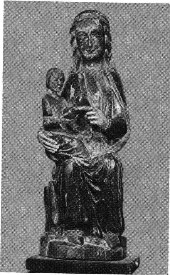
Abb. 248 (oben): Mariazell in der Steiermark (Österreich), Pfarr- und Wallfahrtskirche (Benediktiner-Superiorat). Holzstatue, thronende Madonna mit Kind, aus der Übergangszeit von der Romanik zur Gotik, seit dem Barock prunkvoll bekleidet. Ähnlich wie in Einsiedeln in einer kleinen Gnadenkapelle inmitten der weiträumigen Wallfahrtskirche aufgestellt.