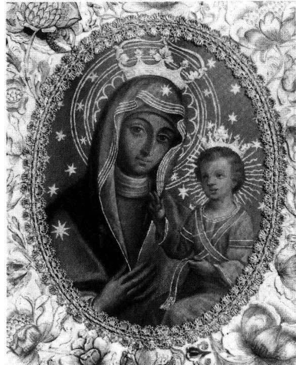
Abb. 239 (links oben):

Maria im Fensterglas oder Mutter im Glase in Absam bei Hall im Tirol (Österreich), Pfarr- und Wallfahrtskirche St. Michael. Am 17. Januar 1797 auf einem Stubenfenster erschienenen Marienantlitz.