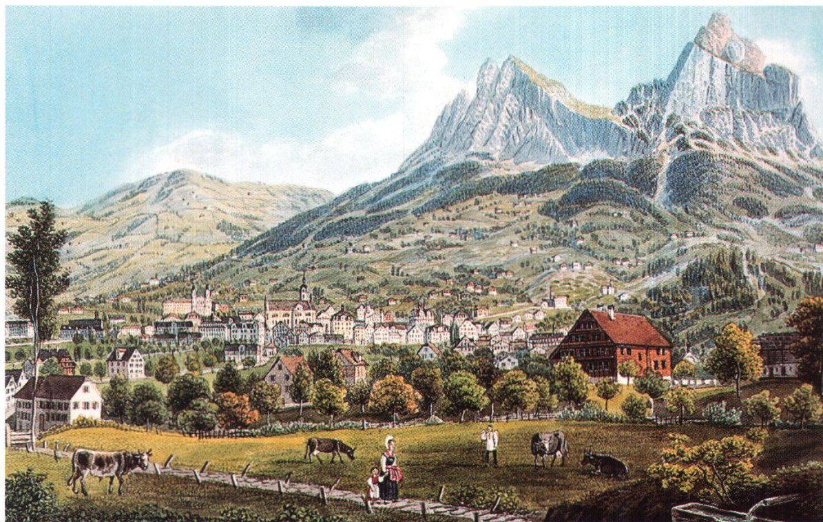
Abb. 3: Schwyz. Ansicht von Süden. Links über dem Flecken Schwyz thront das 1844 von den Jesuiten erbaute Kollegium (Kirche und Westflügel, der Ostflügel wurde erst 1858/59 erbaut). In der Bildmitte am Fuss des kleinen Mythen befindet sich die Haggeneegg. Aquarell von David Alois Schmid (1791–1861).

formung des Kantonsnamens «Schwyz». Dieser Name 54 in seiner mittellateinischen Form Suetia sei übrigens fast identisch mit jenem von Schweden, ein Beweisstück mehr für jene vielen Schwyzer und Schweizer (besonders auch im Oberhasli), die an ihre Abstammung von eingewanderten Schweden glaubten. Für den Ethnographen ist die seltsam tiefe Verwurzelung dieser Herkunftssage im Volksbewusstsein interessant, mehr als ein für ihn unwahrscheinlicher historischer Kern. (I, S. 341, 150–153)