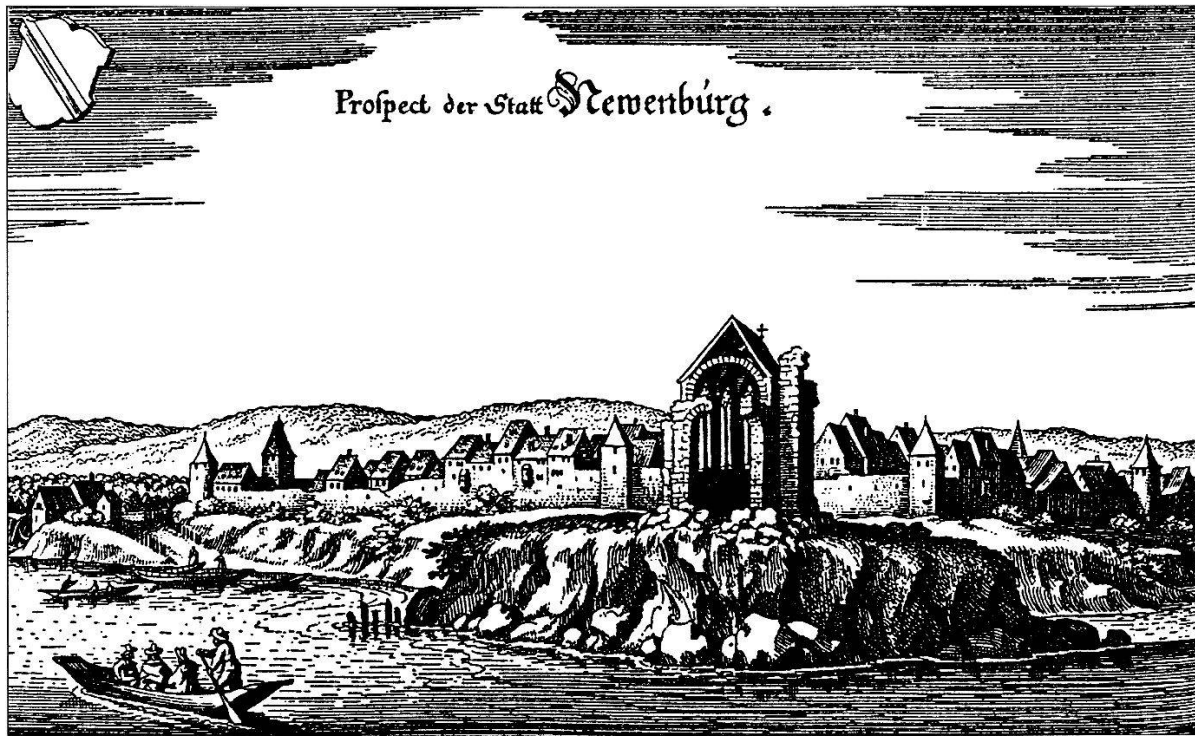
Abb. 3: Ansicht der Stadt Neuenburg im Breisgau um 1643 nach einem Stich von Matthäus Merian.

heissen beim Übergang von den Grafen von Freiburg zu den Herzögen von Österreich weitgehend unverändert. Den Herzögen diente dieses Amt allerdings nun nicht mehr der Durchsetzung des herrschaftlichen Willens. Der eigentliche stadtherrliche Repräsentant, der allerdings nicht in der Stadt residierte, war nun der Hauptmann oder Pfleger der oberen Landvogtei, später der Landvogt. Allerdings liess sich die Besetzungskompetenz dieses für die Kommune wichtigen Amtes versilbern! Denn während des gesamten Mittelalters versuchte die Kommune immer wieder, durch Verpfändung das Schultheissenamt in die Hand zu bekommen. Dies ist um so einsichtiger, als die städtische Rechtsprechung weiterhin weitestgehend in den Händen des Schultheissen lag. Darüber hinaus war er auch an den politischen Entscheidungen beteiligt.